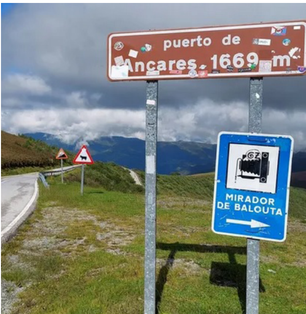
Porto dos Ancares · Xabier Moure

O Porto de Ancares, a 1.669 metros de altitude, é un paso natural situado entre os concellos de Navia de Suarna (comarca dos Ancares) e o de Val dos Ancares, antes Candín (O Bierzo). Seguramente xa foi utilizado durante a prehistoria, e sen dúbida durante a conquista romana tal como nolo testemuña a proximidade de campamentos, explotacións mineiras ou asentamentos estables. Ata non hai moito, tamén foi paso obrigado para acceder ás brañas, utilizadas polas xentes das aldeas próximas para, cando chegaba a primavera, levar o gando e sementar os cereais, establecéndose en poboados temporais ata pouco antes da chegada das Neves. Pero o tránsito de persoas, animais e carruaxes non se detiña coa chegada do mal tempo por territorio tan agreste. Pola contra, a tradición oral fálanos de que esa meteoroloxía tan adversa nunca foi un impedimento para manter unha comunicación permanente entre ambos lados da serra, feito confirmado, tamén, pola documentación escrita.