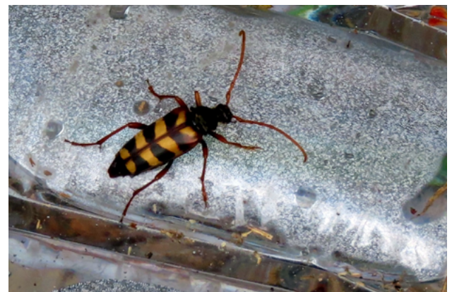
Longuicornio · Xosé Salvadores