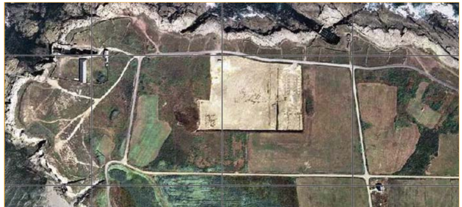
Plano e foto aérea do sixpac da zona na que está proxectada a Ruta das Cetarias. As antigas cetarias, á esquerda.

mente habitado por artistas, fotógrafos, biólogos, ornitólogos, surfistas, pescadores, e paseantes tal e como é, sen redeseñalo nun "non-lugar", é dicir, transformalo en algo mediocre, sen estilo, edulcorado e substituíbel?