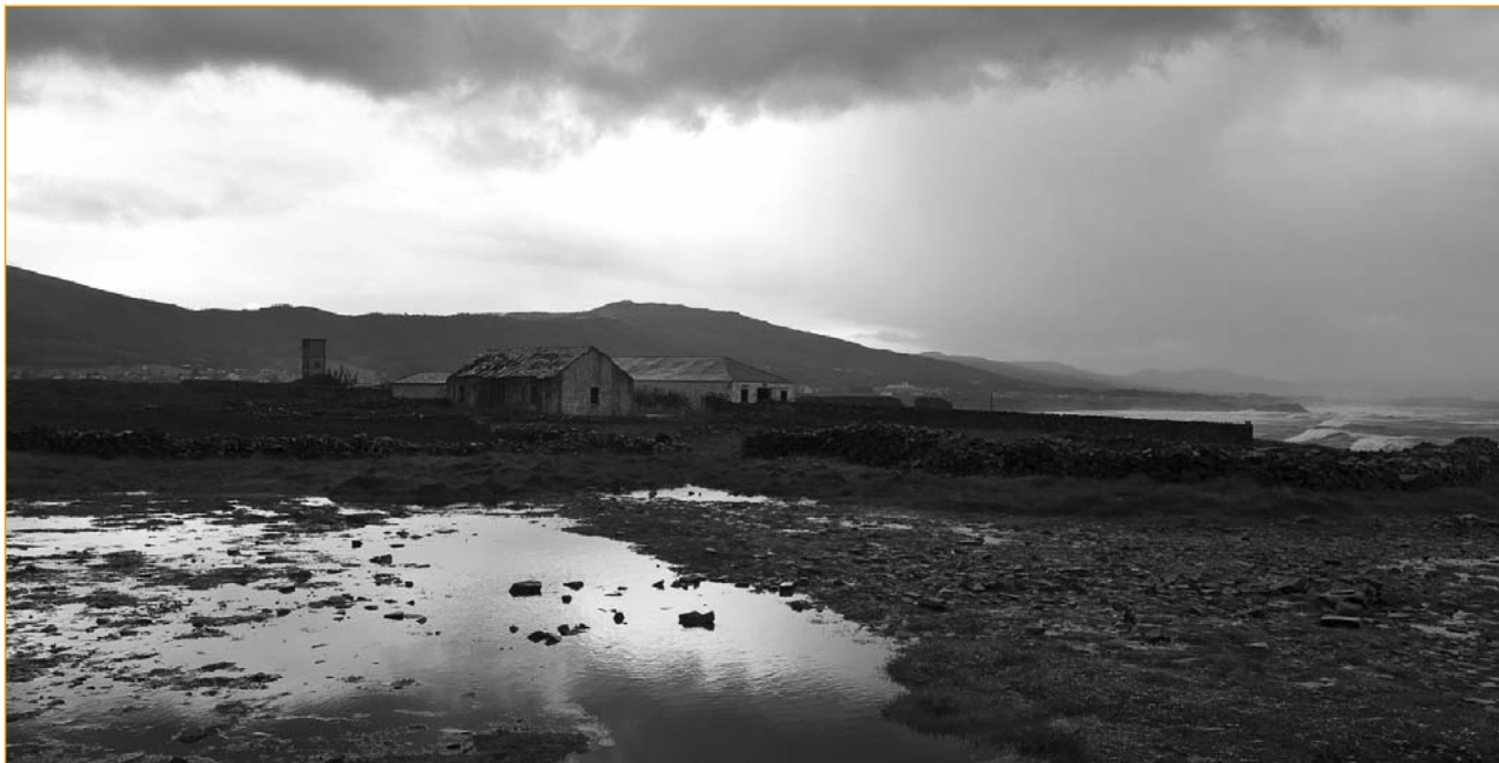
Antigas cetarias de Rinlo (Ribadeo).

pequena entidade. Estamos afeitos a escoitar as palabras "recuperación" e "posta en valor" que na mente de todos e todas nós teñen connotacións positivas relacionadas coa rehabilitación do patrimonio pero non é este o sentido en que a Dirección Xeral de Costas as emprega. Que entenden o Estado español e a DPCL por "recuperar"? Os sinónimos e palabras afíns polos que se guía o Ministerio do Medio Ambiente nas súas actuacións son: "rescatar" "redimir" "reconquistar" "salvar" "liberar". De que ou de quen se supón que necesita Costas liberar este tramo de costa recóndito e natural? Se nos atemos aos efectos ou consecuencias do proxecto proposto a resposta é: dos seus usuarios locais e da súa memoria.