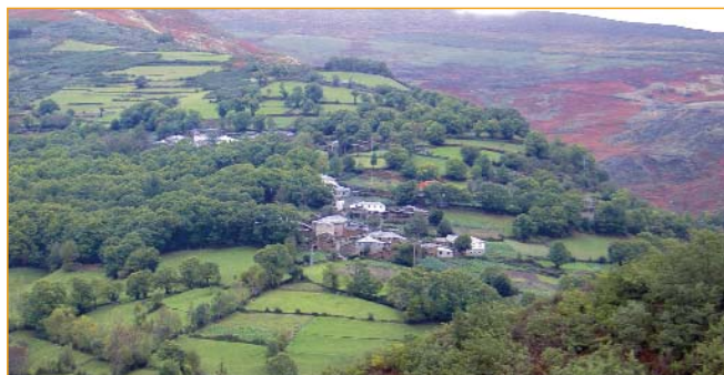
A paisaxe humanizada e en mosaico é trazo característico do Courel.