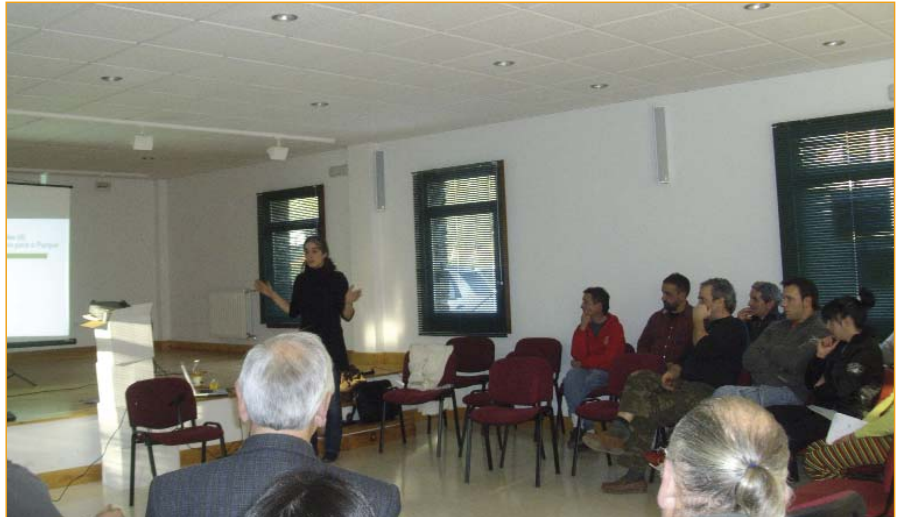
A rolda de debate no Courel congregou a moi diversos colectivos.

o seu negocio aos requirimentos dun espazo protexido.