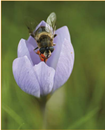
A riqueza florística do Courel dota de calidade aos seus produtos, como ao mel.