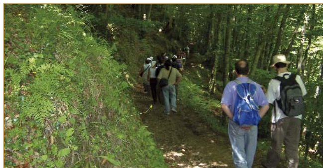
A montaña de Lugo é o límite occidental de distribución da faia.