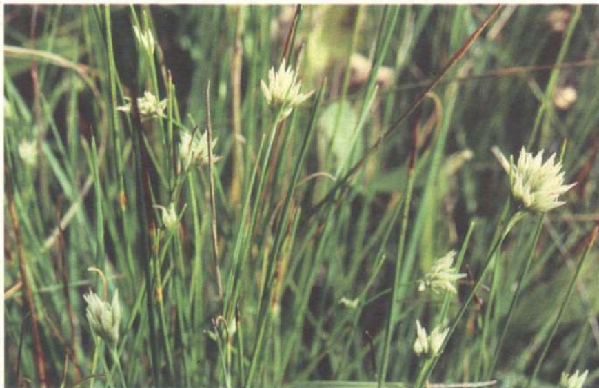
Arnica montana subsp. atlantica , unha planta característica das brañas de Galiza e Norte de Portugal.

no fondo da cunca onde se establece a turbeira. Outras de tipo minerótrofo presentes na Galiza son as chamadas turbeiras planas inundables ligadas a fondos de vales amplos como en Carnota, Foz ou Ribadeo ou a depresións sedimentarias como as de Xinzo, Terra Cha, Maceda, etc., xeralmente en relación coa presenza de lagoas ou ríos. Entre as minerótrofas están tamén as chamadas de pendente ou ladeira ligadas á presenza en media ladeira da alta montaña, de afloramentos da capa freática que xenerarán as condicións adecuadas para o establecemento de pequenas turbeiras. Localízanse nas serras orientais da Galiza así como na área do Xistral. Similares a elas e presentes igualmente nas grandes serras da Galiza son as chamadas de obturación glaciaria e as de alvéolo de alteración, as primeiras xeneradas en morrenas glaciarias e as segundas ligadas á típica alteración en alvéolos das rochas graníticas. Entre as turbeiras minerótrofas son máis frecuentes na Galiza, polo tipo de sustrato, as oligótrofas como as do Bocelo, Monte Meda, Lamachan, etc. máis as hai tamén mesótrofas, como as de Ponteceso ou Teixeira e eutrófas como as de Braña Rubia e da Capelada.