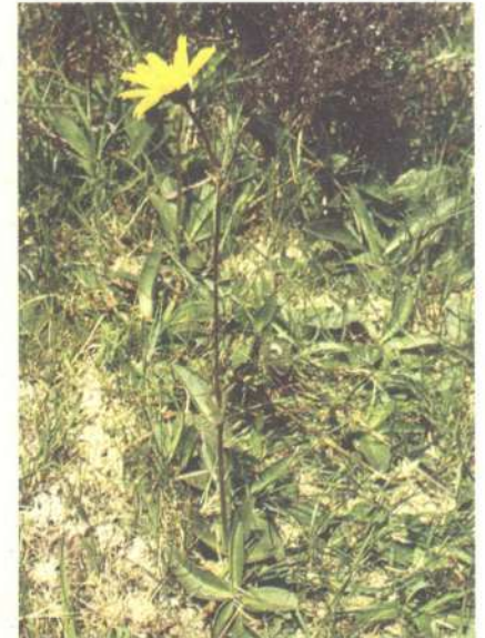
Rynchospora alba , unha das plantas típicas das turbeiras de cobertor.

As charcas e pequenos cursos de auga que soen existir nas partes máis profundas da cunca de recepción están xeralmente colonizadas por unha serie de comunidades vexetais moi pobres