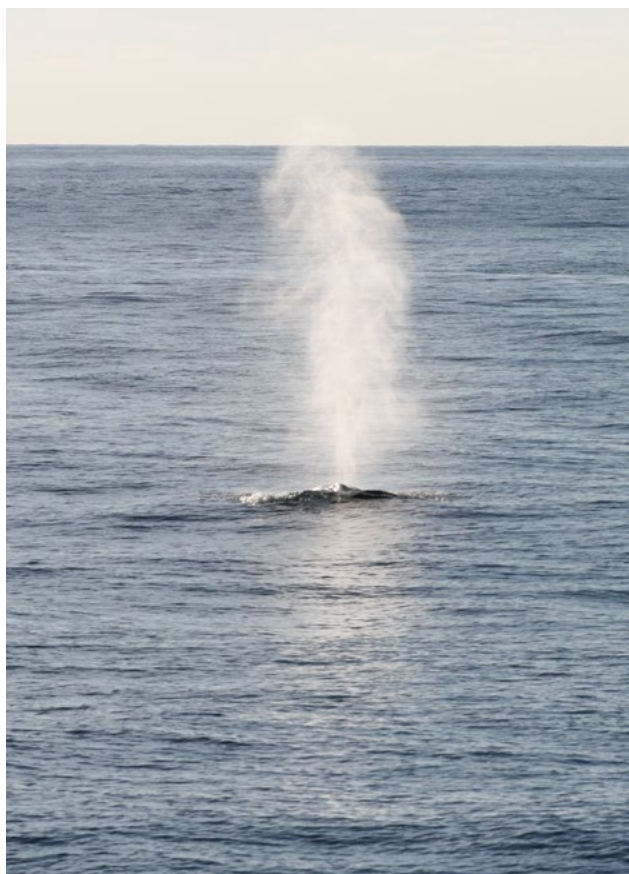
Balea común nas costas galegas · CEMMA

coñecemento sólido do sistema oceánico poderanse tomar decisións prudentes e efectivas.