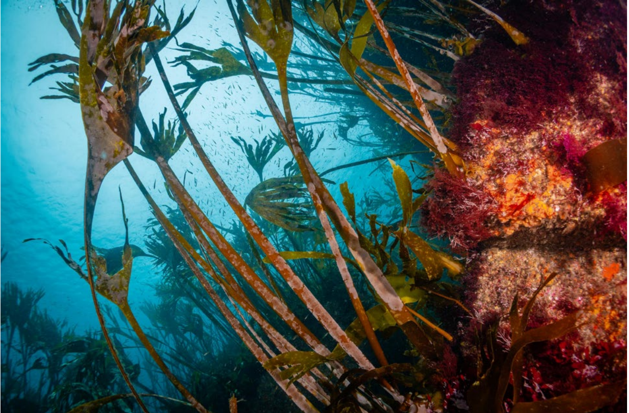
Laminaria no fondo mariño galego

Importantes lagoas na investigación do carbono oceánico poderían invalidar algunhas predicións climáticas globais. Esta é a alerta da novo informe coordinado pola UNESCO e que analizamos neste artigo.