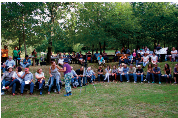
No 27 de setembro, a Eira da Joana, ADEGA ea Irmandade Moncho Valcarce fizeram umha homenagem à figura do cura das Encrobas.