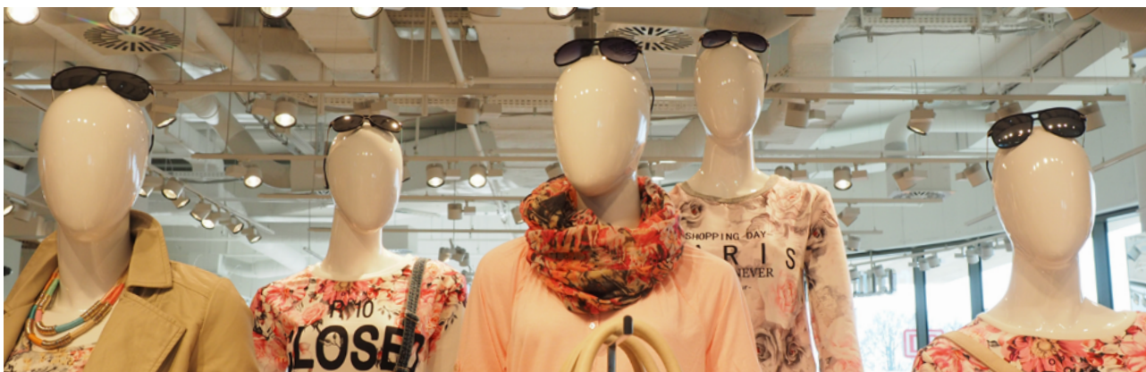
O fast fashion é un sistema de produción e consumo baseado na xeración de residuos, contaminación e esgotamento de recursos

A produción de tecidos e prendas xera até o 10% das emisións globais de gases de efecto invernadoiro, e pode superar a media tonelada de CO 2 equivalente por persoa ao ano. As fibras sintéticas emiten máis que as naturais, mentres que o algodón consome moita auga. Ademais, xéranse grandes cantidades de residuos téxtiles, que acaban incinerados, en vertedoiros ou exportados a países empobrecidos. Recíclase menos do 1%. A explotación laboral é outra das caras da moda rápida. Neste artigo analizamos estes impactos e as alternativas para reducir a pegada do noso vestir e calzar.