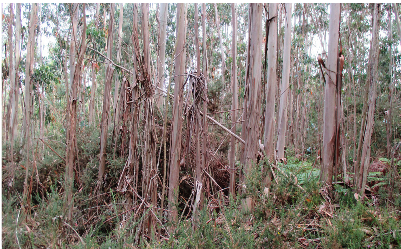
Parcela de mostraxe nun eucaliptal no Parque Natural das Fragas do Eume

As plantacións de eucalipto cobren aproximadamente o 30 % da superficie forestal galega e xeran gran preocupación polo seu impacto na biodiversidade. As aves forestais, bioindicadores da saúde destes ecosistemas, foron estudadas en 240 parcelas nas Fragas do Eume para avaliar a influencia da estrutura e composición da vexetación sobre a súa presenza e abundancia. A proporción de eucaliptos presente nas parcelas foi o factor máis determinante na redución da riqueza e abundancia de especies. As árbores autóctonas maduras demostraron ser cruciais para as aves especialistas, mentres que os eucaliptos maduros non lograron exercer un papel ecolóxico equivalente.