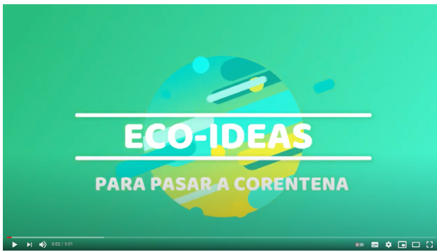
Presentación común para todos os vídeos da campaña.

O contido audiovisual pódese ver a través da web e da canle de YouTube de ADEGA ( https://youtube.com/user/adeqainfo ), aberta a todo o público.