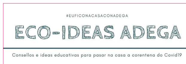
Cabeceira da web e das fichas Eco-Ideas.

Partillamos o material na web da asociación e nas redes sociais baixo o cancelo #EuFicoNaCasaConADEGA. Tamén enviamos as novidades de forma periódica ás persoas asociadas e simpatizantes mediante os correos de ADEGA-Infoma. Pero a cantidade de recursos acumulouse a un ritmo moi rápido, ao que tamén se foron sumando os recursos enviados por outros colectivos. Así, a continuación veu a creación dun espazo web, moi necesario para podermos recompilar e ordenar todos os materiais didácticos e educativos. Xurdiu a páxina http://euficonacasa.adega.gal/