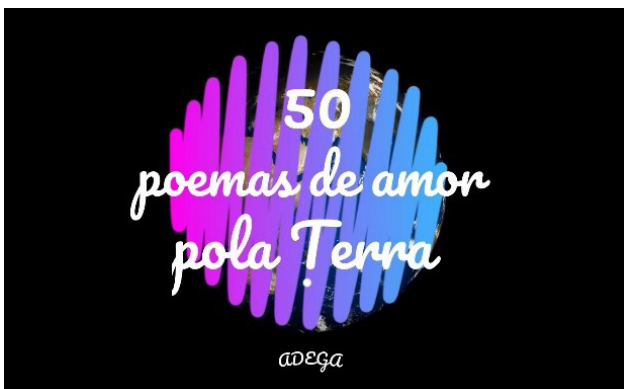
Deseño da entrada aos vídeos polo Día da Terra.

Outra acción sinalada tivo lugar na semana previa ao 22 de abril, recompilando máis de 50 poemas de amor á terra, escollidos por cada persoa