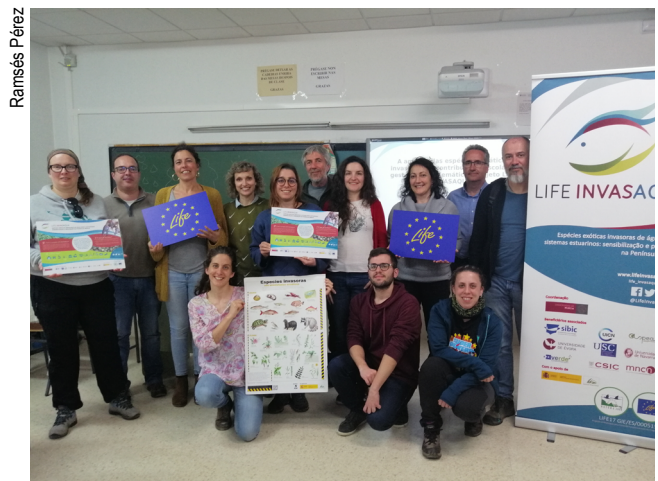
Xornada co profesorado do LIFE Invasaqua.

O traballo de Proxecto Ríos e ADEGA na difusión da problemática das especies invasoras e as accións e programas desenvolvidos para a súa eliminación motivou que fora unha das entidades colaboradoras do Proxecto LIFE Invasaqua, iniciativa que nace no ano 2018 co obxectivo de apoiar a comunicación, a xestión e a difusión de información sobre as especies exóticas invasoras (EEI) acuáticas na península ibérica. Está