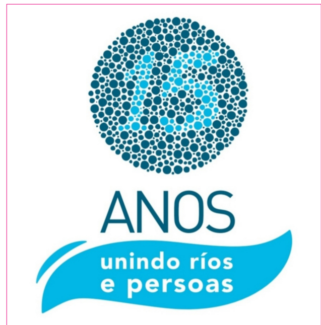
Logotipo dos 15 anos do Proxecto Ríos.

Portais web dos DiadES e QuiroRíos, iniciativas nas que se integra o Proxecto Ríos.