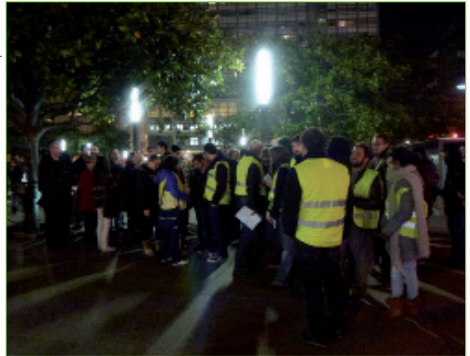
En febreiro deste ano, a Plataforma pola Mobilidade da Coruña subiuse ao transporte público da cidade para divulgar o seu manifesto por unha mobilidade sostíbel.