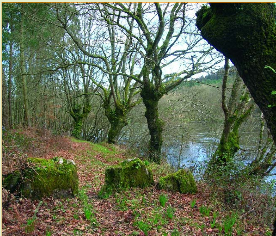
Por este lugar preténdese facer pasar a autoestrada de circunvalación que cruza o Miño en Lugo

Non se libran deste culto á construción os bens etnográficos: castros, camiños reais ou mámoas e conxuntos líticos quedan desfeitos ou sepultados baixo as construcións, se non hai alguén que denuncie a súa existencia e posta en valor.