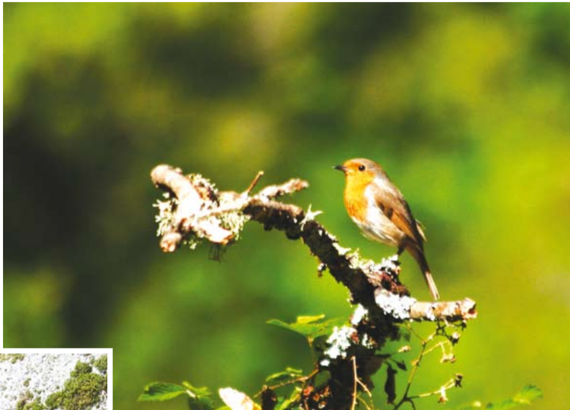
Paporrubio e pintigas propias da zona.

As serpentinas de Melide, protexidas sobre o papel –que non na práctica– pola Zona de Especial Conservación chamada Serra do Careón (Rede Natura), son unha zona quente de biodiversidade na Europa, principalmente no aspecto botánico, xa que conta con varias especies exclusivas desta área (endemismos), isto é, só se encontran aquí en todo o planeta: unha herba de namorar Armeria merinoi , unha margarida grande Leucanthemum gallaecicum , Santolina melidensis , Centaurea janeri subsp. gallaecicum e outras aínda en descrición. Todas elas ameazadas pola súa escasa área de distribución e as transformacións dos seus hábitats, pese a estar listadas no Catálogo Galego de Especies Ameazadas (Decreto