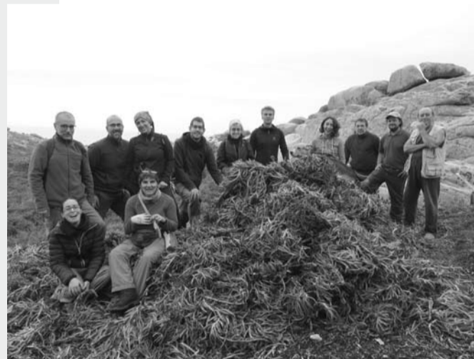
3-4/10/15: CAMPO DE VOLUNTARIADO AMBIENTAL NA ILLA DE SÁLVORA para a eliminación de flora exótica invasora, organizado por ADEGA coa colaboración da DX de Conservación da Natureza e o PNMTIAG.