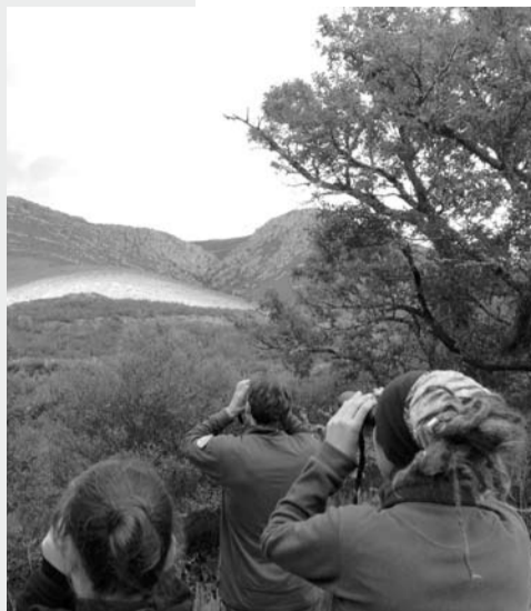
14-18/09/15: CAMPO DE VOLUNTARIADO AMBIENTAL no PN do Invernadoiro desenvolvendo diferentes actuacións de divulgación, estudo e conservación da biodiversidade galega. Foi organizado pola Dirección Xeral de Xuventude e Voluntariado da Xunta de Galicia e realizado por ADEGA.

ADEGA traballa arreo na defensa ecolóxica de Galiza, como podes ollar neste breve resumo das últimas semanas. Non fiques parada: súmate á defensa ecolóxica de Galiza, visita a nosa web (adega.gal) e participa nos grupos activos ou faite socia/o.