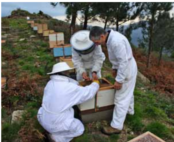
A apicultura é un dos nosos referentes

Por outra banda, conseguimos restaurar uns 12 muiños que percorren a senda que baixa polo Río Xabriña.