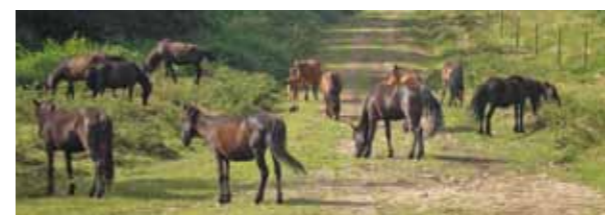
Cabana de Cabalos

Sistema sostible encamiñado a incrementar a rendibilidade económica social e ambiental do monte e prevención de incendios forestais.