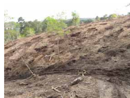
Repoamento con especies autóctonas

Ao redor do antigo campo de fútbol, grazas á comunidade de montes, creouse un sendeiro de 1km por un parque forestal, alén de un parque infantil e outro biosaudable.