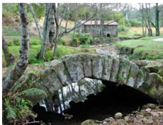
Recuperación de patrimonio