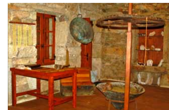
Lagar de cera restaurado