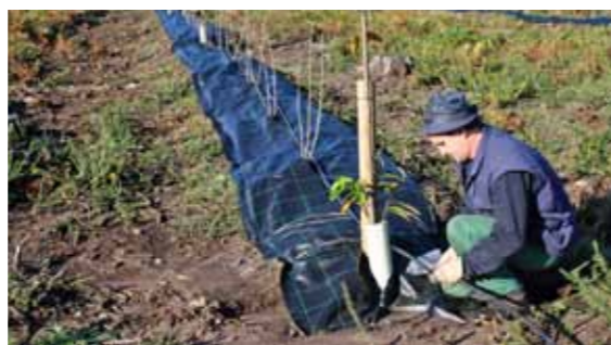
Diversificamos as producións arbóreas