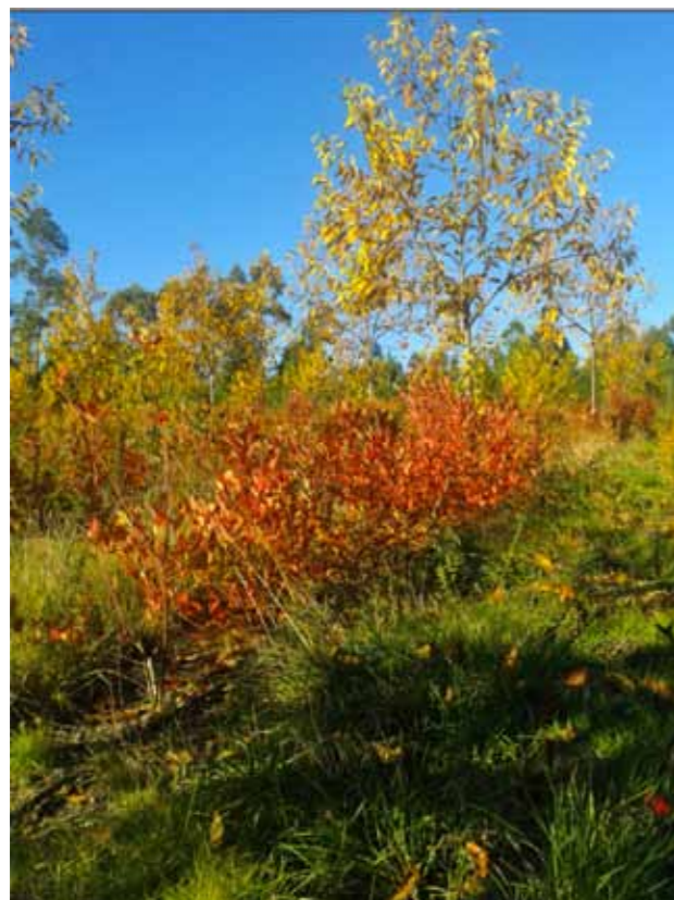
Arandeiros e castiñeiros no outono, antes de tirar a folla.

Os produtos que comercializa son froitos frescos e conxelados. Tamén realiza labores de asesoramento e proxectos para novas plantacións (a persoa que desenvolve a experiencia é enxeñeiro técnico forestal).