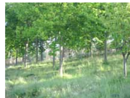
Os castiñeiros teñen 14 anos, dan boa colleita de castaña e cogómelos

Co paso do tempo, o terreo foise reverdecendo, á distancia apréciase o contraste desa superficie onde os eucaliptos e os toxos deixaron sitio a unha variedade espontánea que espertou do chan. Pasaron os anos e o cambio é moito grande, sendo o máis impresionante a capacidade de recuperación das especies. Na zona do manancial xurdiu unha masa de bidueiras, salgueiros e carballos de xeración espontánea que, xunto co souto, son as zonas máis frondosas do terreo.