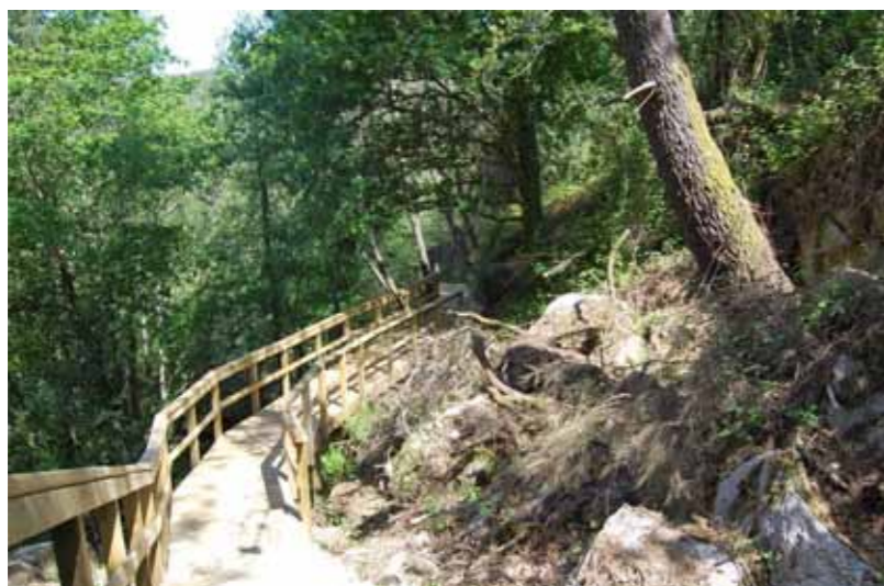
A ruta de sendeirismo

A comunidade de Montes de Couso quixo poñer en valor os elementos culturais do seu monte para uso e goce de todos os que quixesen. Creou unha ruta de sendeirismo durante a cal se atopan varios muíños e aceas restauradas. Teñen unha acea de roda vertical, que aínda funciona e un muíño restaurado que tamén moe con normalidade. Actualmente teñen outros 3 muíños en fase de restauración e un por amañar.