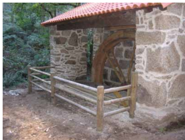
A moedora, tras a restauración.