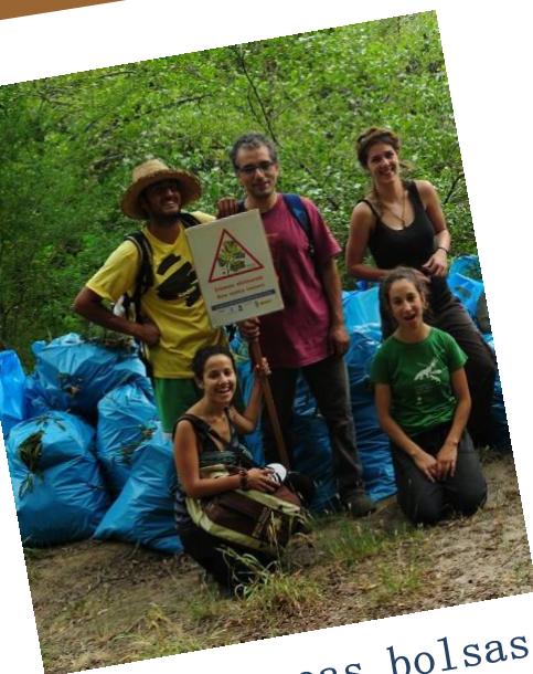
Grupo coas bolsas