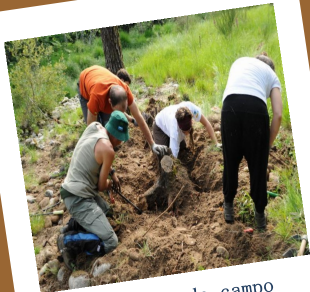
Traballos de campo

Eliminación de flora exótica invasora 30, 31 de maio e 1 de xuño