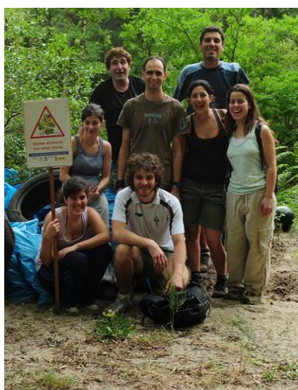
de invasoras eliminadas