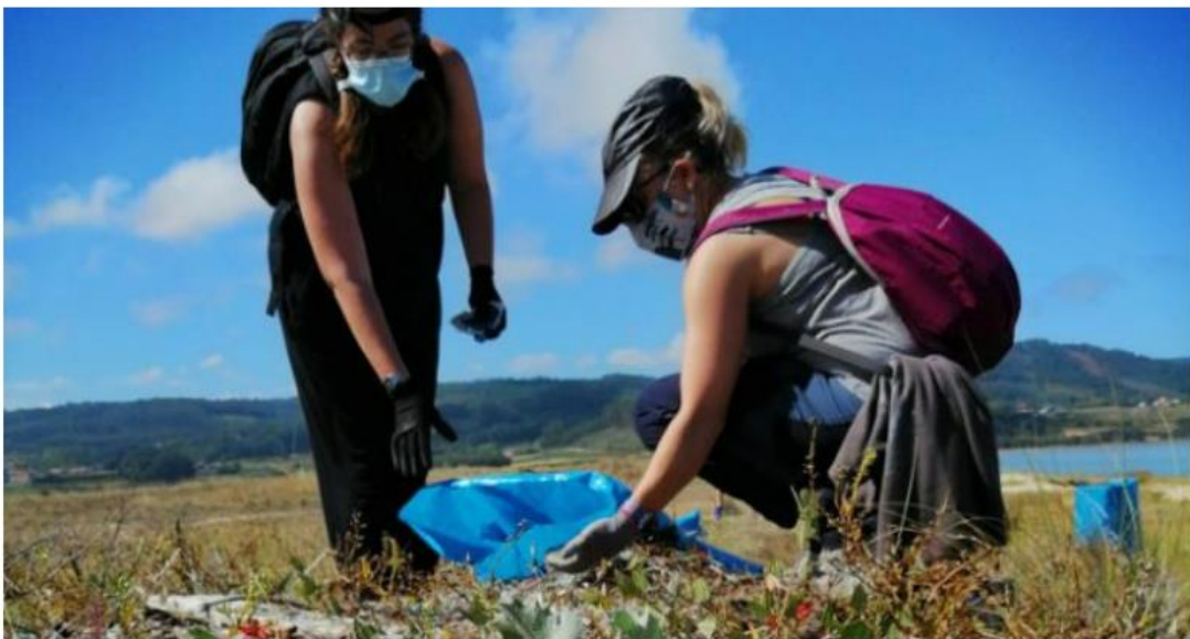
Imagen de archivo de una limpieza de playa hace algunas semanas

FERROL360 | Sábado 3 octubre 2020 | 9:32