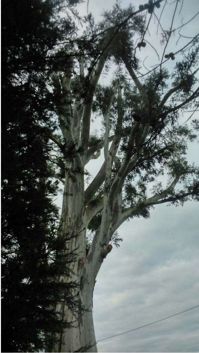
RESTOS DAS POLAS TALADAS NO CHAN