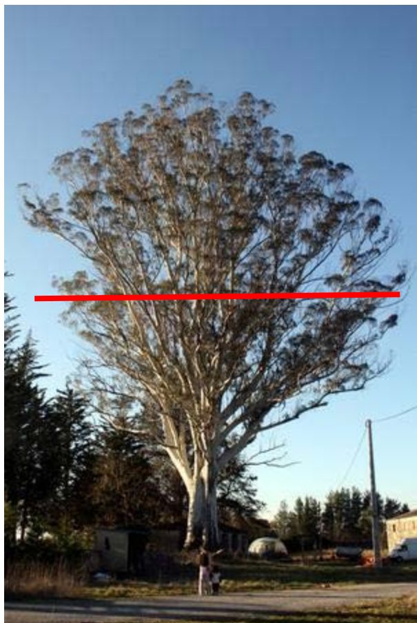
ANTES DA PODA