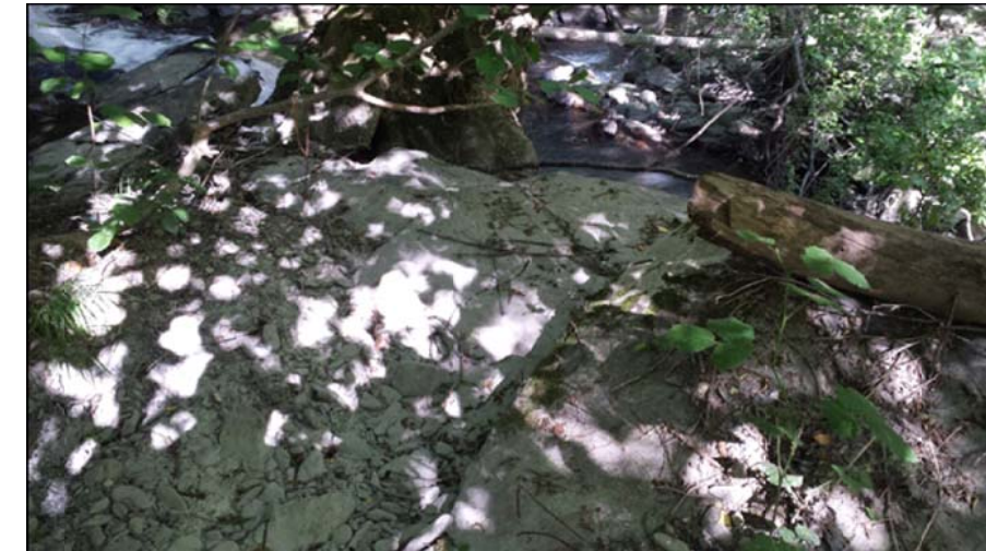
Sedimentos exógenos en "O Ferradal"