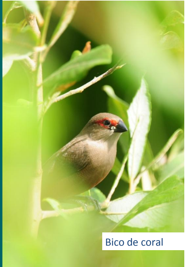
Bico de coral