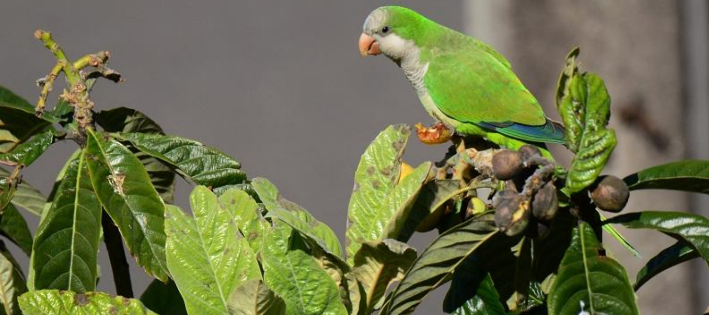
Cotorra arxentina comendo os nesperas

Ás veces as persoas liberan no medio as súas mascotas unha vez que se cansan delas, medran demasiado ou o seu comportamento non é o que esperaban; son molestas e ruidosas ou teñen un comportamento agresivo. O porco vietnamita é un claro exemplo de mascota que estivo de moda e unha vez, esta pasou, foron liberados no monte causando problemas de hibridación co xabarín e polo tanto provocando contaminación xenética.