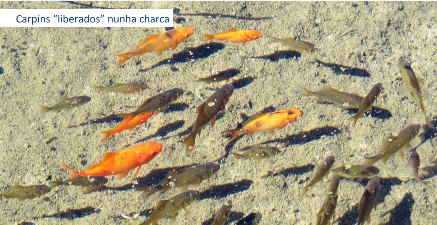
Carpíns “liberados” nunha charca