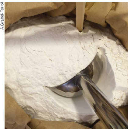
De esquerda a dereita: Produtos de limpeza a granel na tenda 4eco (Pontevedra); diferentes produtos e xeitos de mercar a granel na tenda A Granel (Ferrol); fariña de arroz a granel na tenda Legumia (Compostela).