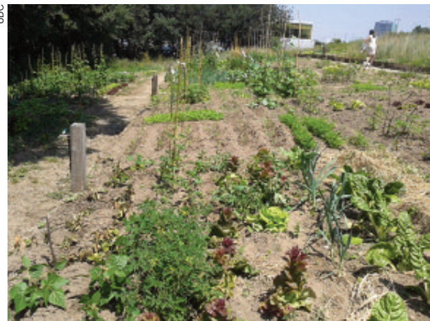
Hortas comunitarias no Campus Universitario da UDC.

Este municipio apostou por recoller o lixo de xeito separado e na porta da casa, onde cada veciño/a deposita a fracción que corresponda segundo o día de recollida. Que se conseguiu?, unha taxa de reciclaxe do