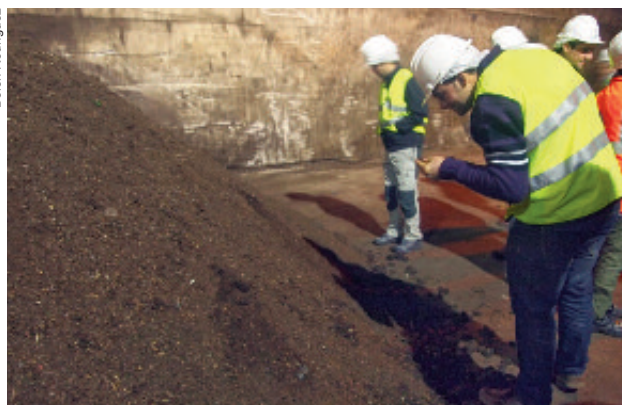
Pila de compost resultante de todo o proceso de compostaxe.