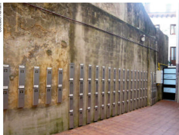
Colgadores para a recollida porta a porta no casco histórico de Hernani.