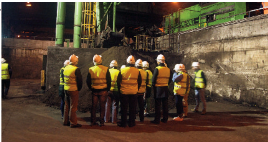
Visita dos participantes no Foro á planta de compostaxe do Barbanza.