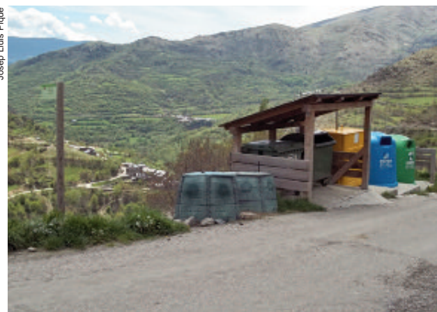
Área de compostaxe comunitaria en Pallars Sobirà.

80%, polo tanto só queda o 20% para incinerar. Deste xeito, botaron abaixo a necesidade da construción dunha incineradora. Ademais de acadar este obxectivo, obtiveron outros logros, como a creación de 15 postos de traballo locais, que son os recolletores. "En efecto hai un incremento no custo da recollida, pero aforramos en taxas da planta ao enviar só un 20% dos residuos", dixo Intxauspe. Lembremos que na Galiza pagamos taxas polo 90% dos residuos xerados, máis a recollida.