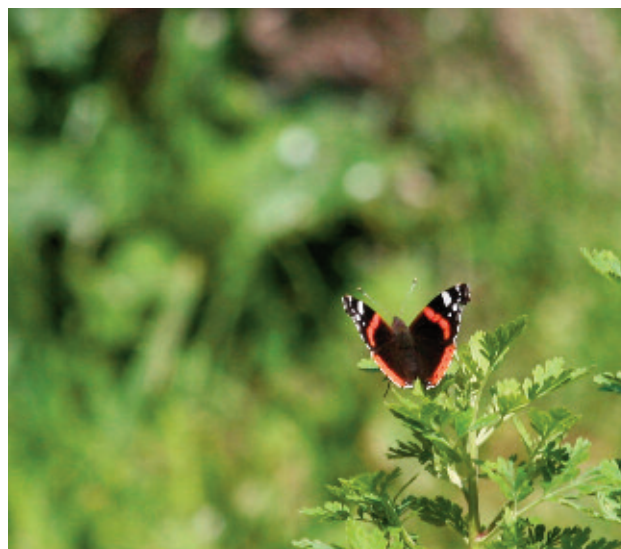
Vanessa atalanta .