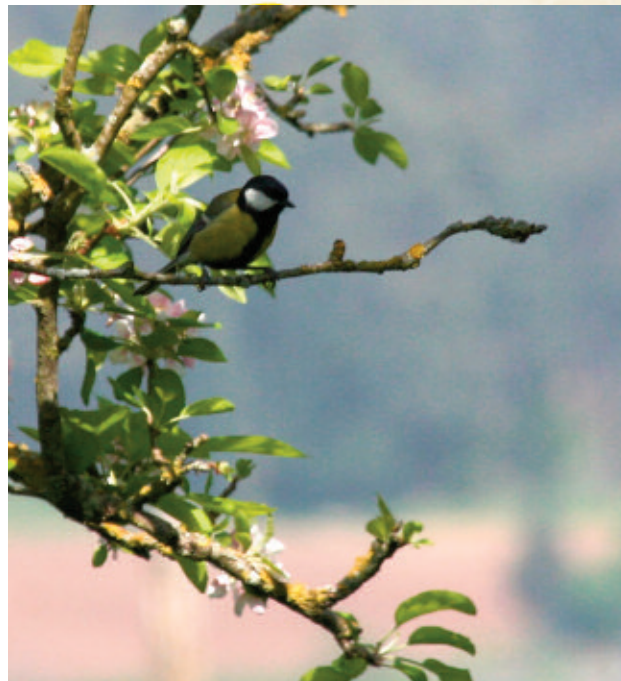
O ferreiriño abelleiro.

Por último, foi unha bolboreta sen acougo a que se instalou no meu maxín para completar o cadro que plasmaba a escena. Tampouco é das máis rechamantes que temos, aínda que as cores estean ben escollidas e contrastadas. Era unha común Vanessa atalanta , que nin tan sequera hiberna todos os fríos e que podemos atopar calquera día que teña unha morna raiola dando unha volta polo seu territorio. Pero aquela bolboreta lembroume outra, pousada na fachada dourada polo sol poñente na igrexa de Santa Mariña en Petín, e tiveron saudades da primavera apoteósica vivida un ano atrás nas fantásticas terras de Valdeorras.