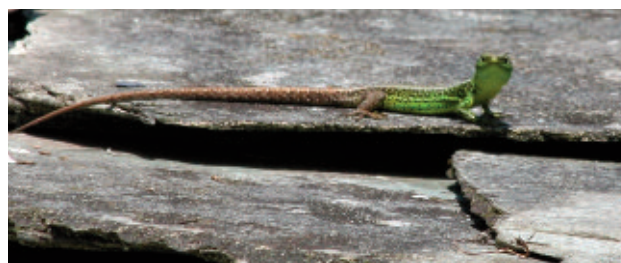
Lacerta monticola .