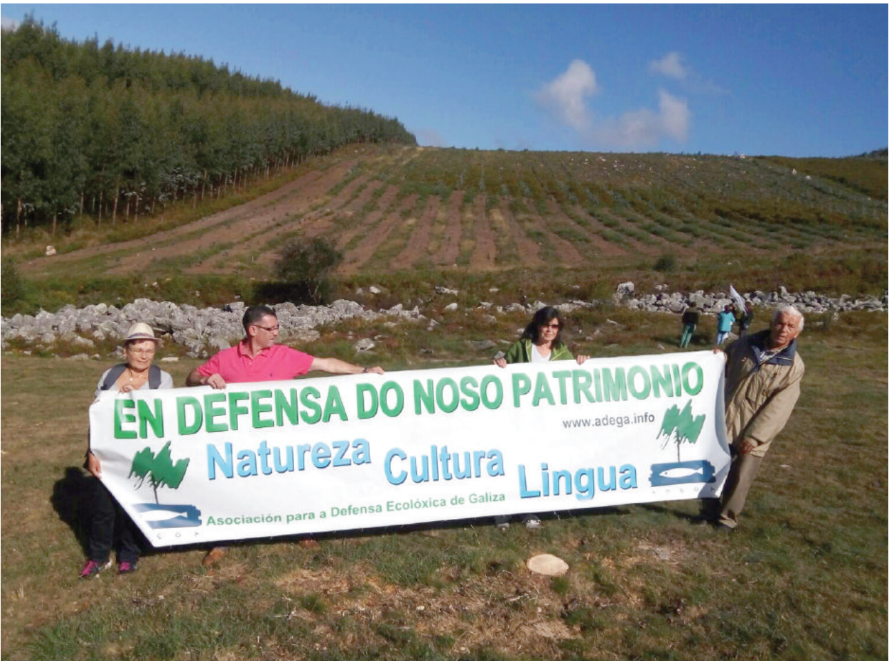
Ao fondo, unha parcela dunhas 5 Ha plantada con eucalipto nitens a carón do Pedregal de Irimia que, tras a denuncia de ADEGA, é legalizada pola Confederación Hidrográfica Miño-Sil.