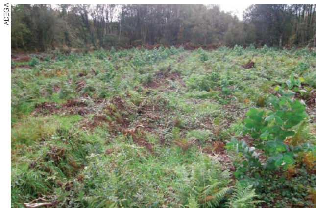
Plantación de eucaliptos realizada tras a tala dunha masa multiespecífica de bosque autóctono, denunciada por ADEGA en Begonte.