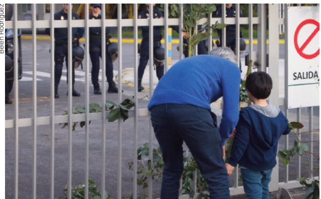
Ao remate da Marcha contra Celulosas de Pontevedra do pasado 3 de xuño, varios manifestantes colgaron ás portas do complexo industrial de ENCE-Elnosa pólas de eucalipto.