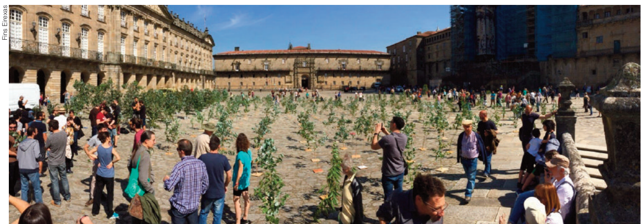
No Día da Terra de 2017, Cousa de Raíces e a Asemblea contra a eucaliptización de Compostela simularon unha plantación de eucaliptos a Praza do Obradoiro para chamar a atención sobre a expansión descontrolada da especie australiana.

Nesta liña, outra reflexión que achegamos desde “Cousa de Raíces” ten a ver co aproveitamento da biomasa. Considerando que a maior parte dos plantíos de E. nitens serán para biomasa, como cultivos enerxéticos de ciclo curto (6-8 anos), que sentido ten que o goberno galego veña de eliminar os condicionantes técnicos e territoriais á biomasa para permitir un número ilimitado de centrais sen restrición algunha de potencia? O aproveitamento da biomasa forestal con fins enerxéticas non debería ser un obxectivo en si mesmo. Debe estar orientada á prevención dos in-