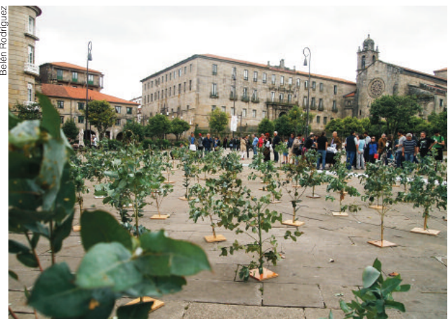
APDR, ADEGA, FEG e Cousa de Raíces realizaron outra repoboación simulada de eucaliptos na Praza da Ferrería de Pontevedra co gallo do Día internacional do Medio Ambiente de 2017.

un 17% do noso territorio. Está presente nos nosos montes, mais tamén nas terras de cultivo, nos espazos naturais, enriba de xacementos arqueolóxicos... Semella que para a industria do eucalipto non existen limitacións: todo vale con tal de seguir engordando a conta de beneficios das celulosas.