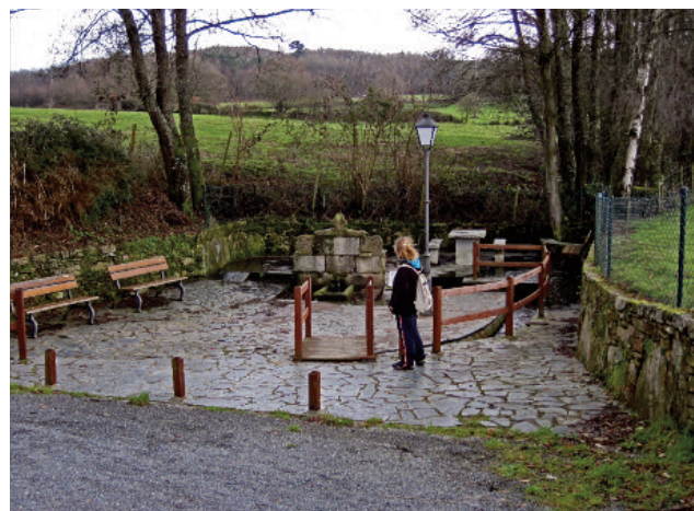
Os proxectos de “adecentamento” ou de “mellora” enmascaran actuacións públicas e privadas, resultado dunha concepción atrasada do que significa o progreso e a mellora das condicións de vida substentábeis. Véxase a fonte de Ribicás (O Burgo, Lugo).