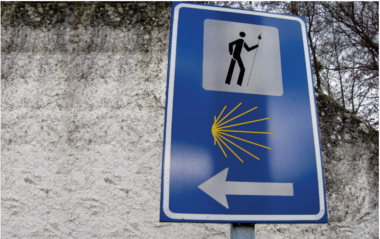
A operación mediática montada arredor do Xacobeo foi devorando a súa esencia e poñendo en risco os fundamentos do seu "éxito", ao devaluar mesmo a propia significación das peregrinacións.