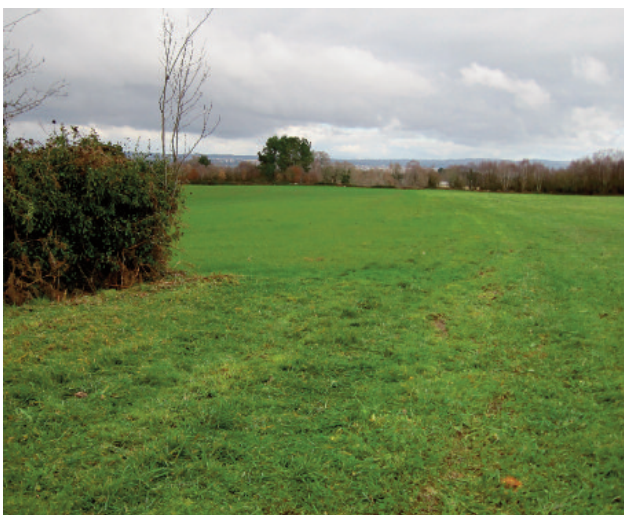
En moitos casos, o trazado orixinal dos camiños de Santiago desaparece ao ser apropiado ou desviado polos particulares e as administracións. Véxase a pegada delatora da presunta apropiación da traza histórica, esquecida pola Xunta en O Alto (Lugo).

Dos camiños públicos e calzadas con valor histórico invadidos nas últimas décadas, non foi recuperado practicamente nin un só metro. Esta é a outra cara do “fenómeno xacobeo”