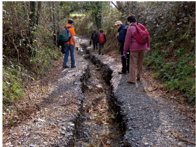
O abandono das calzadas históricas acelera o seu deterioro.

Dúas décadas despois, as nosas cámaras municipais seguen sen inventariar os camiños públicos, sen catalogar e mirar de protexer as calzadas históricas que modelaron a súa paisaxe e asentamentos, permitindo o seu deterioro acelerado ou perda definitiva.