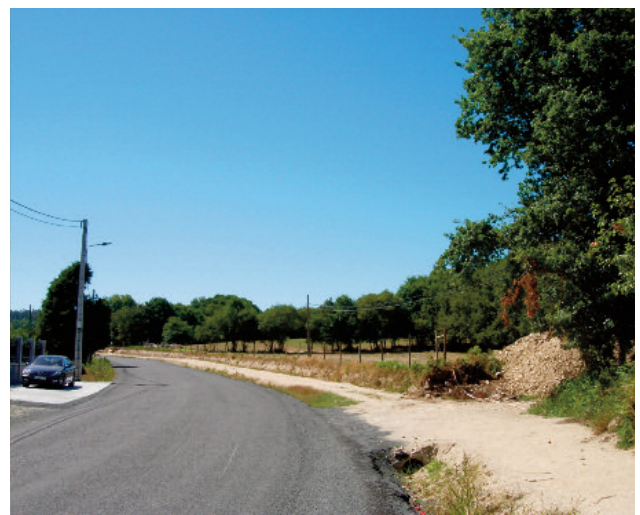
Desvío artificial do Camiño Primitivo, seguindo a estrada para “facilitar” o tránsito dos peregrinos nun treito de calzada histórica ocupada.