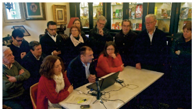
O Foro do Camiño primitivo, formado por 30 entidades culturais, ecoloxistas e sociais, recorreu ante a Xustiza a delimitación oficial do Camiño primitivo por desprotexer a meirande parte do seu trazado histórico.

Don Ramón Otero Pedrayo aseveraba que “canto máis temos andado na vida, máis amor temos aos camiños”. Son as pegadas dos viais de tránsito interxeracional e interterritorial, que trascenden á nosa visión afectiva, os camiños do corazón. Tal é o respecto á historicidade que está en cuestión na delimitación e axeitada protección dos camiños vellos, dos de antes, para os que reclamamos a súa identidade civil. E tamén a nosa demanda de indulto para as derradeiras corredoiras deste noso pobo da noite, porque con elas vai unha parte importante do noso destino.