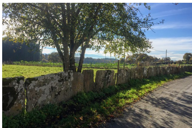
Valado de lousa, manifestación do patrimonio cultural inmaterial · Mercedes Máquez