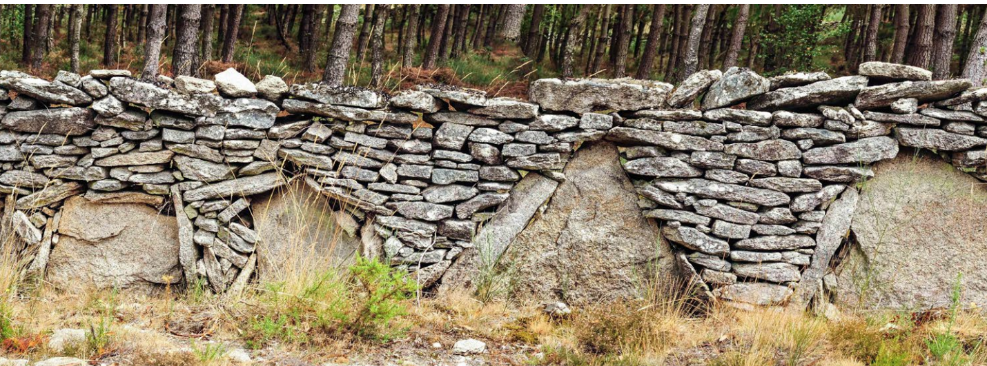
Valado tradicional de cantos e xistos · Hixinio Flores

de tipos: os mais habituais son estacas ou chantos. As estacas usadas tradicionalmente son de madeira ou pedra. Recentemente son utilizadas tamén pezas prismáticas de formigón ou postes metálicos. Este tipo de valados coa súa variedade tipolóxica material (postes de madeira, metálicos, pedra ou formigón) atópanse espallados por toda a xeografía galega, sobre todo cando o uso asociado a ese espazo é o gandeiro.