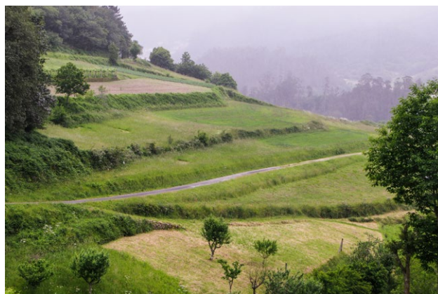
Bancais na comarca do golfo ártabro · Mercedes Máquez