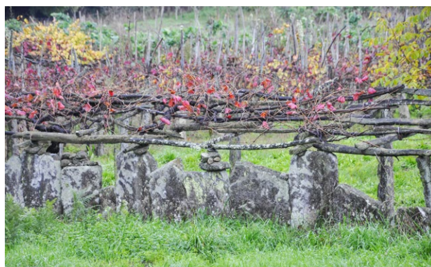
Valado de cantos de granito con viña, Rías Baixas · Mercedes Máquez

zonas, veiga, vilar, estivada ou barbeito, constituía un conxunto de terras de cultivo cun valado perimetral temporal (feito mediante acumulación de terróns, sebes de ramas de toxo e xesta entrelazadas) ou permanente (de pedra ou sebes arborizadas), divididas no seu interior en leiras abertas, cunha forma xeométrica rigorosa, xeralmente estreitas e longas, separadas mediante marcos. A súa extensión adoitaba estar relacionada co rango da aldea, polo que era moi variable, aínda que ficaba comprendida entre as dez e as doce hectáreas. O seu cultivo habitual alternaba o cereal co barbeito.