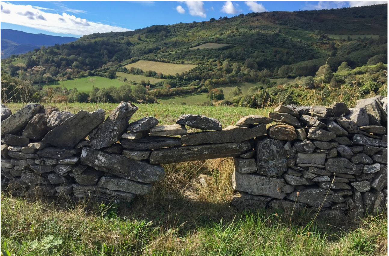
Valado de xisto en Samos · Mercedes Máquez

Son trazos propios da cultura rural aqueles que se atopan na construción dos valados tradicionais: riqueza de tipos, funcionalidade, sobriedade, integración, valor da tradición e dispersión. A proximidade do material, a función e a relación coa paisaxe, xunto coa dimensión estética, cultural e dos xeitos de facer tradicionais explican por que en cada zona se construía un determinado tipo de valados. As tendencias actuais de peches estandarizados, de pouca calidade material e construtiva, que prestan escasa atención ao contexto no que se insiren, están a modificar a paisaxe agraria, o que supón unha perda de calidade e de identidade.