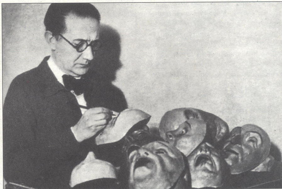
Castelao foi o director da primeira representación de “Os vellos non deben de namorarse”, supervisando e ocupando-se en persoa practicamente de todos os aspectos da posta en escena: escenografía, luces, máscaras....

E, finalmente, o recurso ao “sapo” como animal “mensaxeiro” da morte, no Segundo Lance. En moitas culturas, e na nosa en particular, o sapo ten servido para simbolizar a idea da metamorfose, até acabar relacionado nunha lóxica doada de comprender co “cambio dos cambios”; a vida que dá paso á morte. Curros Enríquez fixo-se eco desta simboloxía no famoso poema en que un vello vítima de mil desgrazas e inxustizas só acha como resposta ás súas queixas e laios o insistente “cró, cró” dun sapo respostón... Non sería estraño que Castelao tomase do poema do escritor celanovés a idea do diálogo entre o fidalgo e o sapo-morte para perxeñar unha das escenas máis impactantes e “espectaculares” dunha obra que figura xa, por méritos propios, no repertorio de auténticos clásicos da nosa dramaturxia.