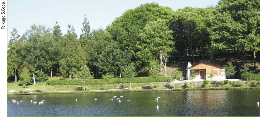
O centro de acollida de visitantes e o lago Castiñeiras.

Hai xa 20 anos un grupo de persoas que naquel tempo formabamos o Grupo de Educación Ambiental LANDRA comezamos, tan xóvenes como inconscientes, a posta en marcha da Aula da Natureza de Cotorredondo. Non é frecuente, especialmente neste país, que un equipamento de Educación Ambiental, un proxecto educativo comprometido e o equipo que o desenvolve sobrevivan dúas décadas, polo que parece pertinente facer memoria e, se cadra, celebrar estas dúas décadas de resistencia.