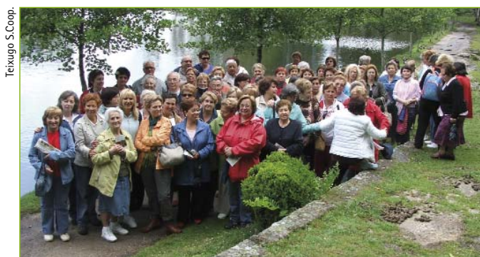
Actividades educativas para toda a sociedade.

+info: www.cotorredondo.net www.teixugo.com