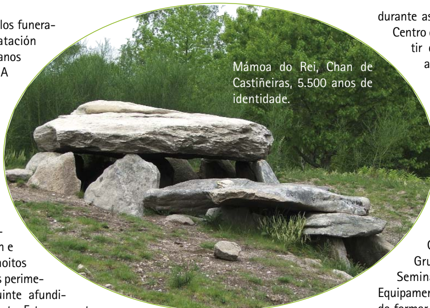
Mámoa do Rei, Chan de Castiñeiras, 5.500 anos de identidade.

Os axentes sociais destinatarios da oferta educativa tamén evolucionaron, e