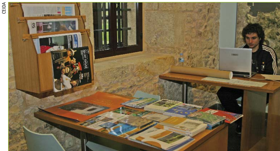
O Centro de Documentación Ambiental Domingo Quiroga dispón dunha Saa de Consultas e tamén ofrece o servizo de préstamo a domicilio.

Desde o Centro de Documentación Ambiental Domingo Quiroga estase a traballar para que a sociedade poida exercer o seu dereito de acceso á información ambiental, e así contribuír a xerar unha poboación sensibilizada cos problemas ambientais e involucrada na procura de solucións.