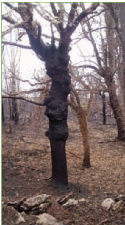
Co abandono chegou o lume, a destrución e a erosión, consumándose a perda da propiedade e dos recursos.

Procedeuse tamén á ordenación e xestión forestal dunha superficie de 740 Ha de propiedades particulares con aproveitamento silvopastoral dos bosques de ladeira para a produción forestal e cárnica. Cooperativízase a planifi-