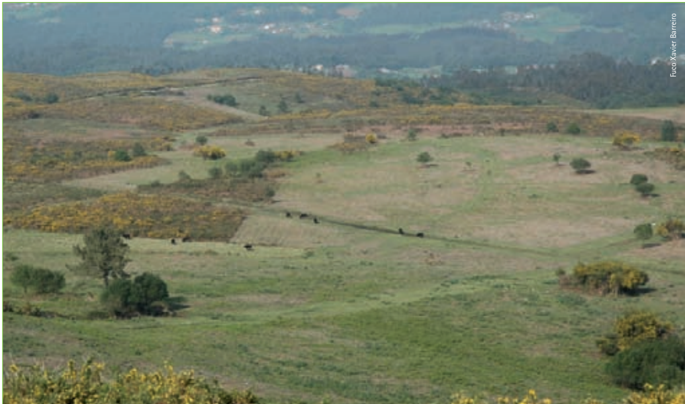
Nova paisaxe Monte Cabalar: perspectiva dun horizonte en produción que integra milleiros de leiras.