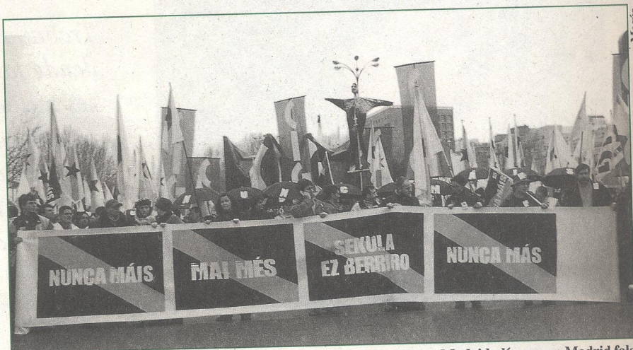
Cabeceira de saída da manifestación de Nunca Máis celebrada en Madrid, día en que Madrid falaba galego