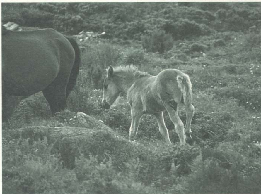
Poltro atacado por lobos (Testeioro).