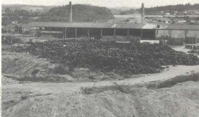
Cerâmicas Campo distribue a súa "actividade ambiental" entre as fábricas do Salnés e de Laracha (esta na foto), consistente na queima de aceites, neumáticos e outros residuos.