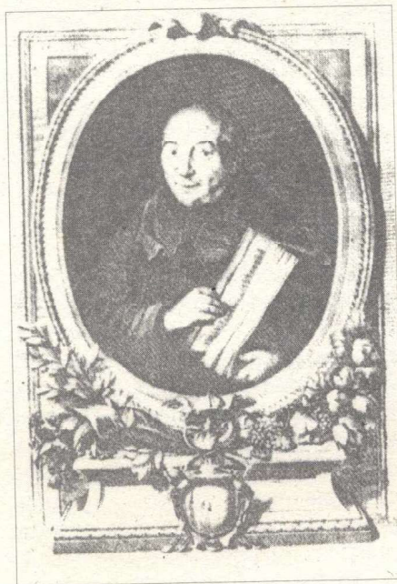
M. Sarmiento. Debuxo de Isidro Carnicero grabado por Francisco Muntaner en 1774. Museo de Pontevedra

Ao longo de toda a súa vida mantivo un grande interese polo que acontecía na Galiza: "Nada veo, nada oigo, nada palpo, nada leo, nada escribo, nada experimento y nada discurro que no tenga a