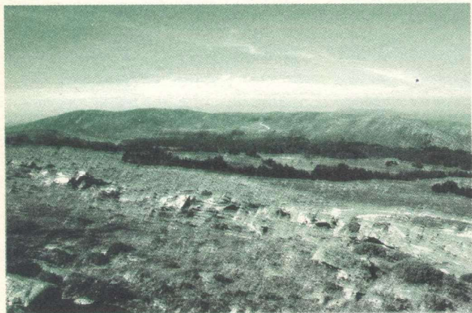
A penichaira e as suaves ondulaci3ns da Serra.