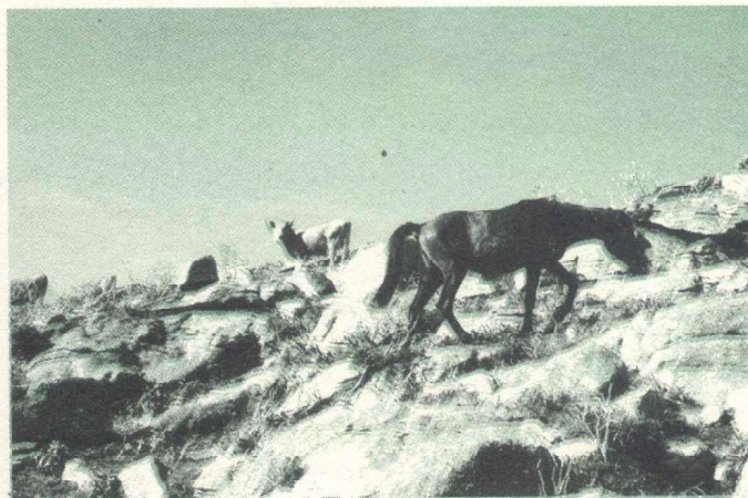
Cabalos e vacas na Serra.

m.) e misturarse cos bloques gran3ticos que o conforman e o proxectan sobre a r3a de Muros-No3a, a paisaxe costeira coas lagoas litorais de Xu3o e Baso3as, as suaves ondulaci3ns, a paisaxe agr3cola e as repoboaci3ns, os escasos n3cleos habitados do interior da Serra, as intervenci3ns humanas nela; a penichaira e os cumios, os cabalos bravos pacendo sen presas arredor da pista, son alg3ns dos aspectos que fan valorar a subida.