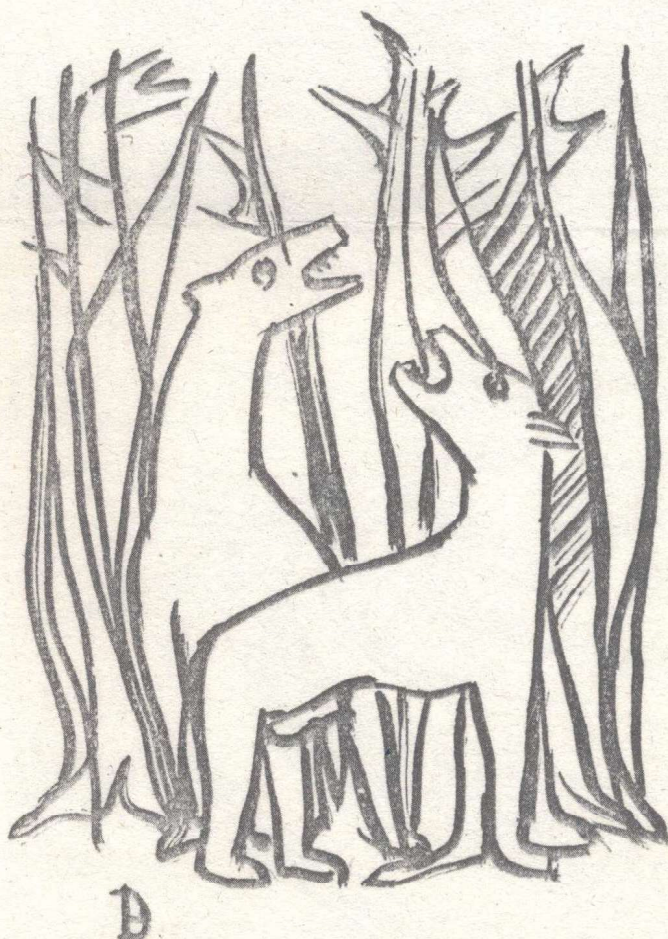
Debuxo de Díaz Pardo que ilustra o poema CAS, pertencente á 4ª edición do poemario Terra Chá.

Mais o Manuel Maria non esgota nesta veta a súa faceta de escritor naturista. É poeta tamén de olladas amábeis sobre o mundo, de identificacións sentidas, de emocións ante a paisaxe, de compromiso ecoloxista. Veremo-lo no próximo número de CERNA. ■