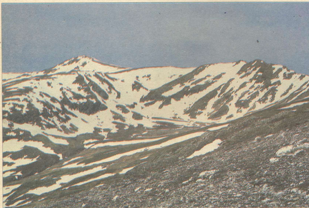
Pena Trevinca (2.124 m.)

están aos pés do Cabrón, sentindo como baixan as nubes a descansar acobillando as estrelas nun manto de misterio.