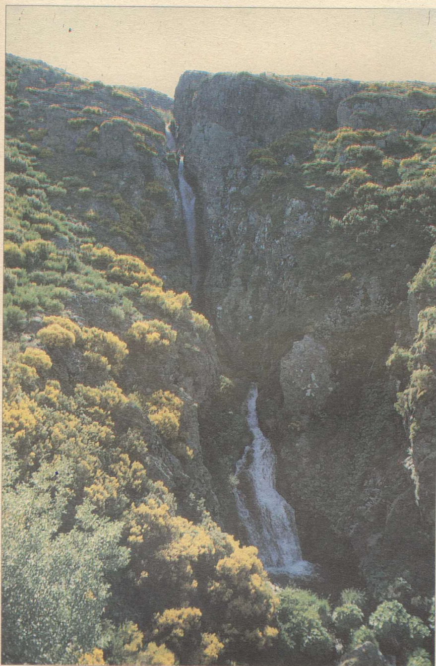
Fervenza do Xares

T emos o tempo como aliado e o sol confire á paisaxe unha luz limpa que destaca as formas do manto primaveral. Foi ano de choivas e de neves e Maio viste as mellores galas nas suaves ladeiras das montañas valdeorresas.