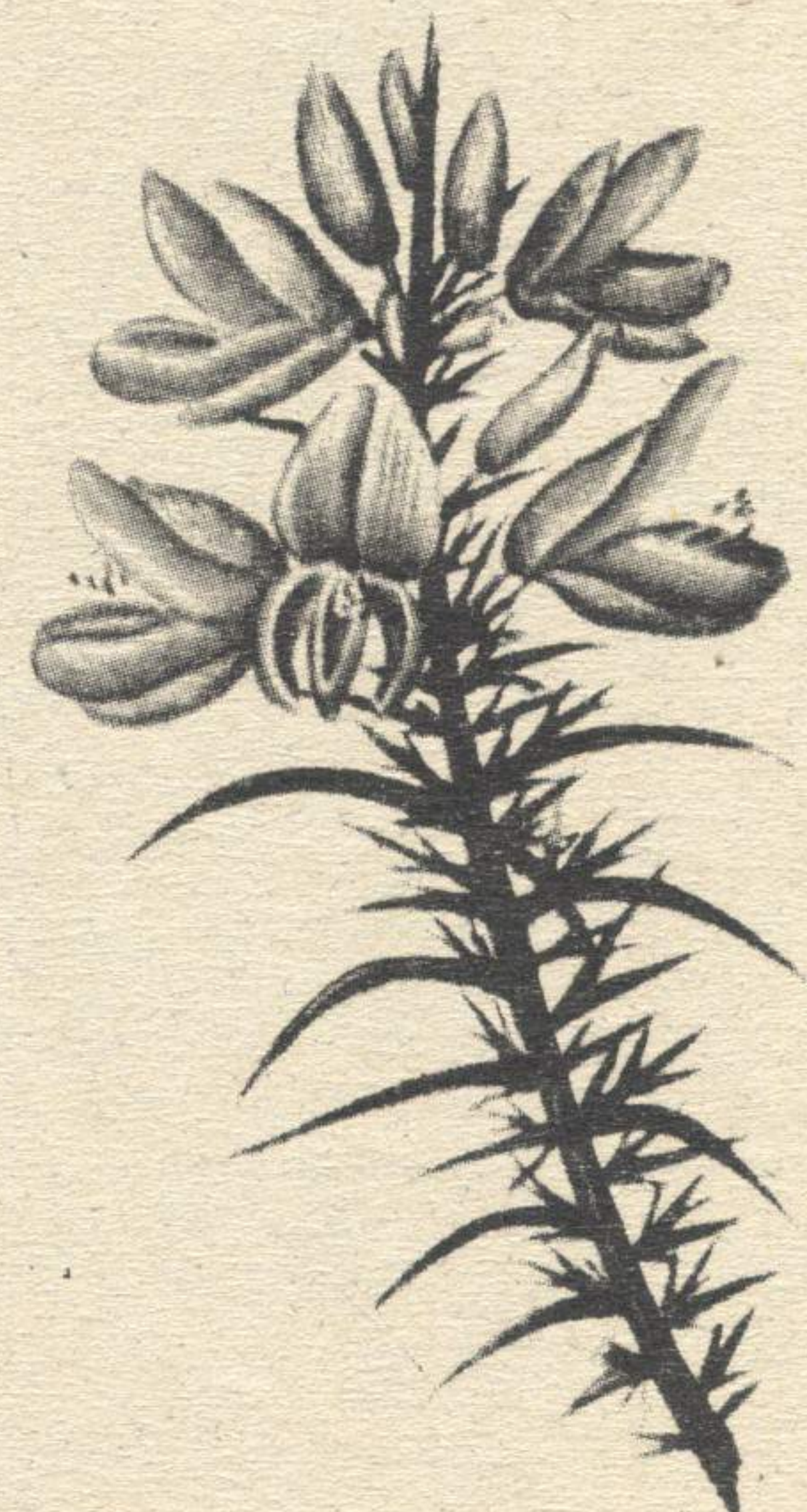
ULEX GALLII PLANCHON

Florece de marzo a agosto atopándose no sur de Galicia.