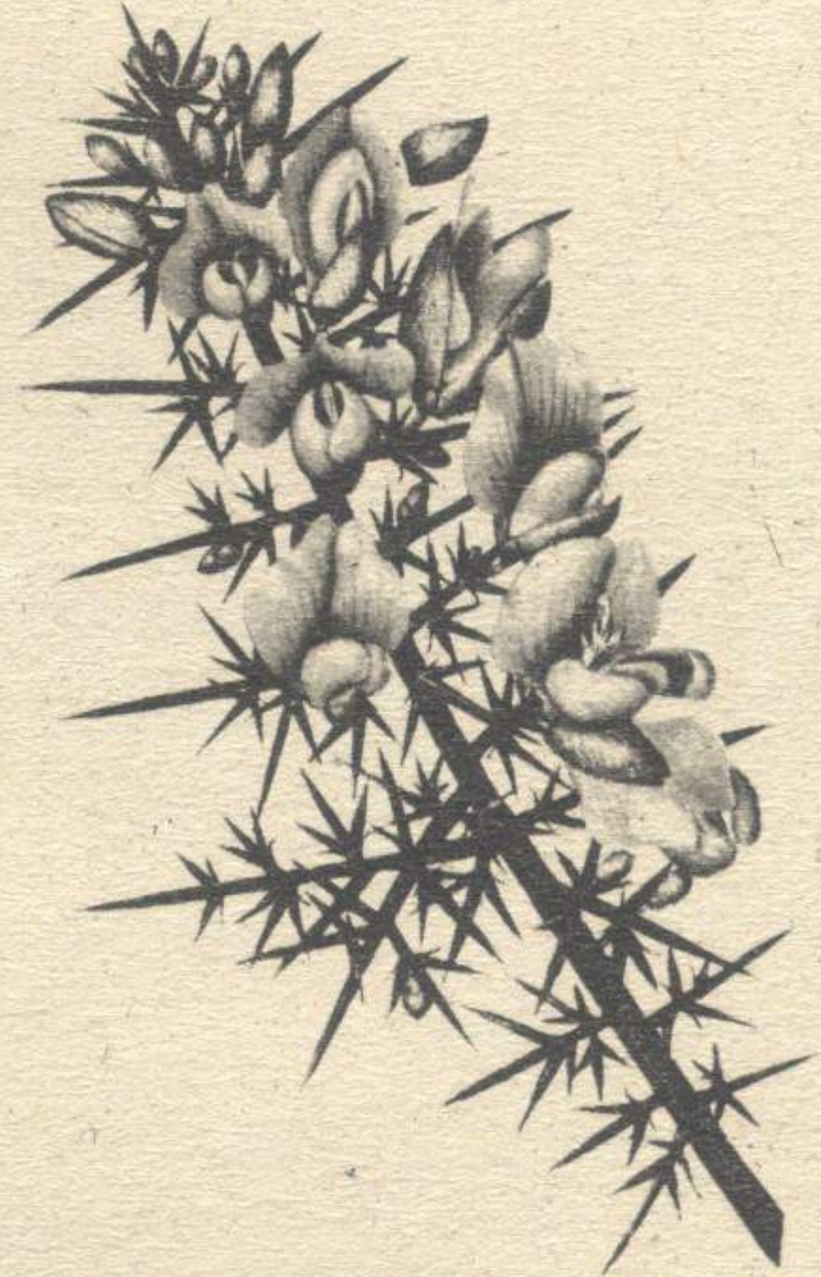
ULEX EUROPAEUS L.

Esta especie florece en primavera e verán, inda que tamén pode facelo no outono, atopándose por toda Galicia.