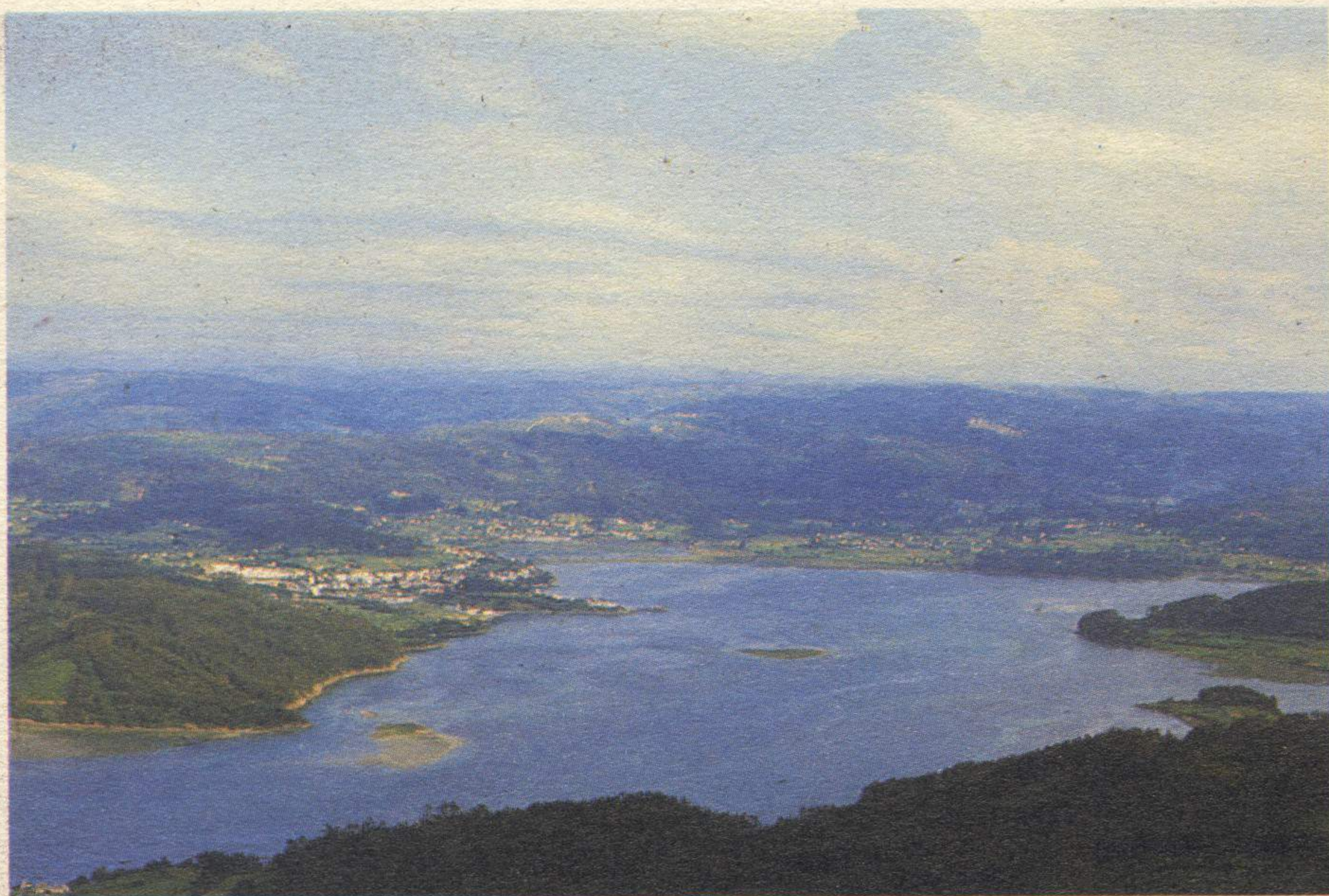
Ría de Ortigueira

"A San Andrés de Teixido, un dos centro de peregrinacións máis importantes de todo o país. vai de morto quen non foi de vivo", e entón pode facelo en forma de animal de calquera especie, particularmente reptís