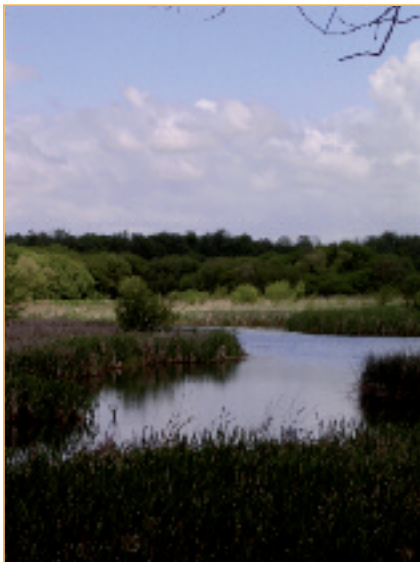
As gándaras de Budiño son un hábitat propio do sapoconcho en Galiza.

Máis recentemente, a introdución de especies exóticas que alteran gravemente os ecosistemas acuáticos, como o cangrexo americano ( Procambarus clarkii ) ou a perca americana ( Micropterus salmoides ), tense manifestado como un problema grave, xa que incluso chegan a depredar sobre os exemplares máis novos e de menor tamaño.