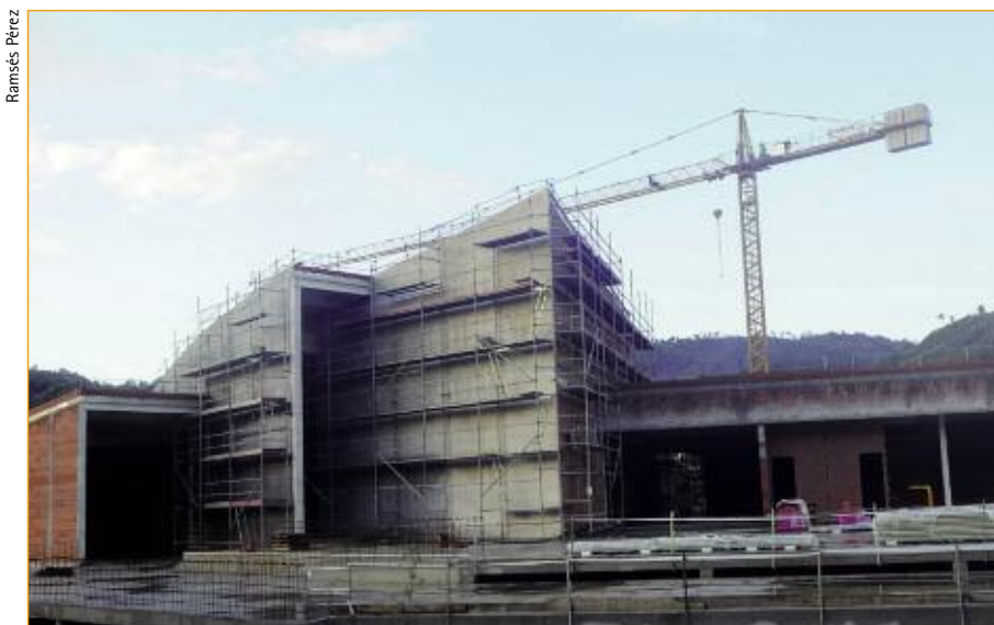
No Centro de Interpretación dos Parques Naturais de Galiza, proxectado na cidade de Ourense, vanse dilapidar 6 millóns de euros.

Alén do reiterativo argumento da crise económica –a escusa perfecta para a "deconstrución" do Estado do Benestar