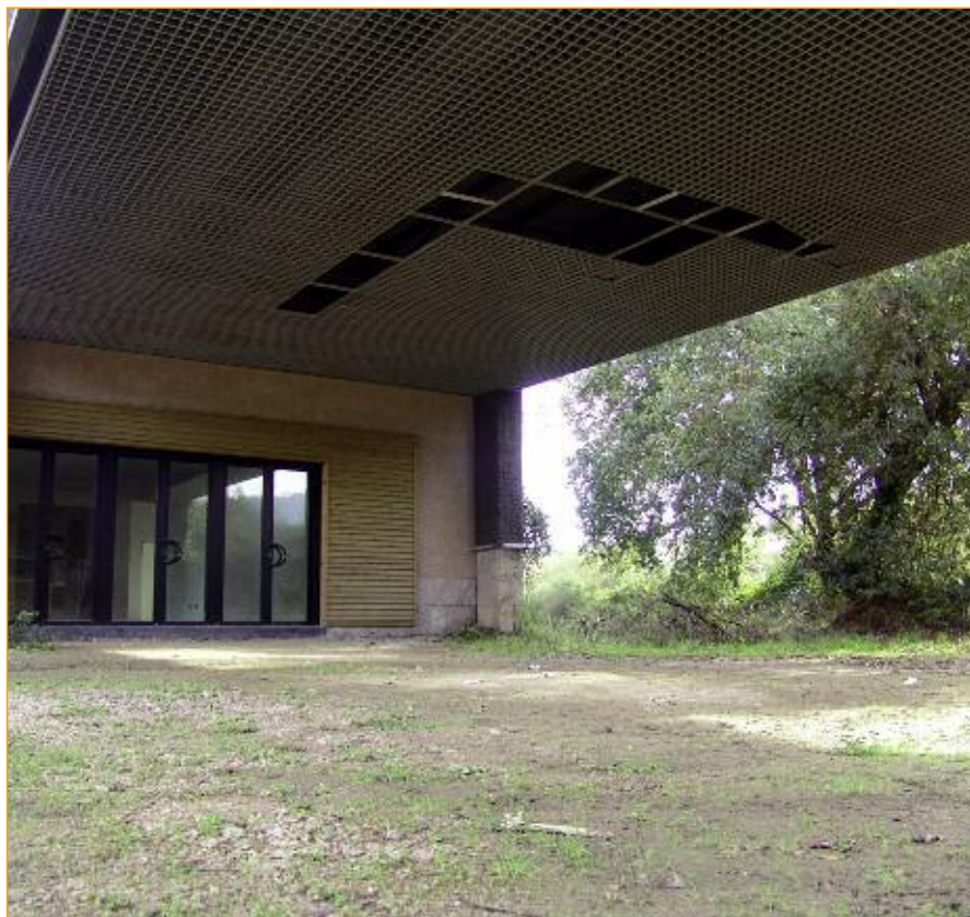
O Centro de Interpretación das Gándaras de Budiño foi inaugurado oficialmente en 2002, pero que nunca chegou a abrirse.

sospeita, probabelmente con razón, que a EA pode ir en contra dos seus intereses políticos, de clase e económicos. Non falta, tampouco, quen pensa que esta é unha oportunidade para que axentes máis "emprededores" –posto que se sobreentende que antes só había "parasitos" que vivían a costa do erario público– tomen a iniciativa e fagan rendíbel, na óptica da empresa privada e do mercado, a demanda social de servizos asociados á calidade do ambiente.