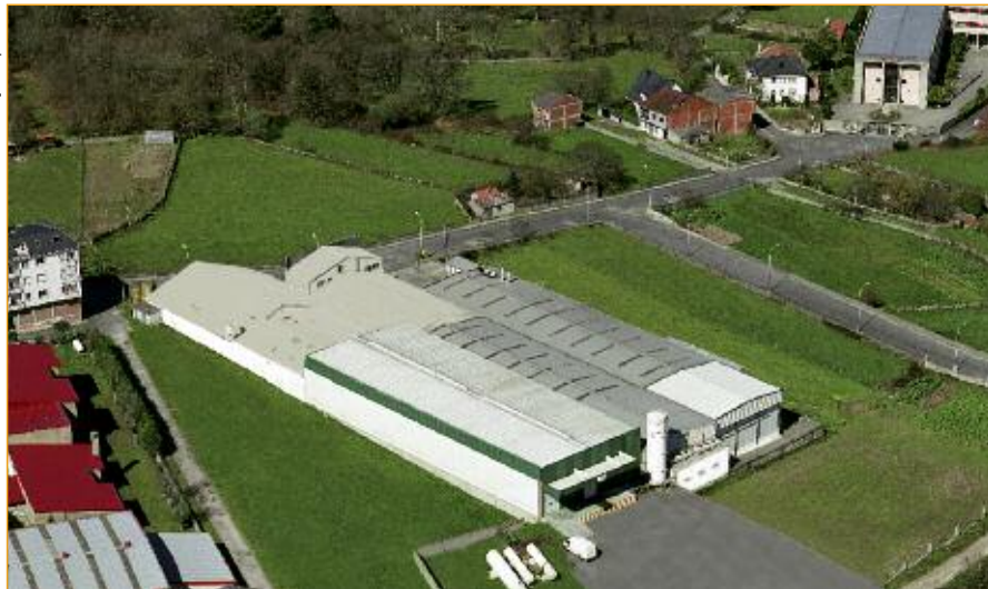
Vista aérea da fábrica en Monterroso.

legado desta política forestal deixounos as mesmas árbores que plantaron os nosos devanceiros, máis abandonadas debido ao éxodo do medio rural galego, pero que aínda así son a base para abastecer as necesidades, tanto de consumo de castaña en fresco como da numerosa industria transformadora galega.