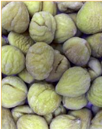
Castañas peladas e conxeladas.

Até hai poucas décadas, a castaña foi un alimento esencial para os galegos e os seus animais, principalmente até o inicio do cultivo da pataca e logo en épocas de fame como as da guerra civil española e a posguerra. Foi un habitual na cociña dos nosos avós, no caldo, cocidas con leite, coa carne, no cocido... Era frecuente que se plantasen castiñeiros no perímetro dunha finca a labradío ou nas beiras dos camiños, con diferentes variedades, unhas máis temperás e outras máis tardías, para prolongar ao máximo a dispoñibilidade de froito para o consumo. Mais o que daquela era unha boa estratexia para o autoconsumo, tradúcese hoxe nun problema de falta de homoxeneidade nas castañas, xa que os lotes compóñense, na meirande parte de casos, de variedades mesturadas.