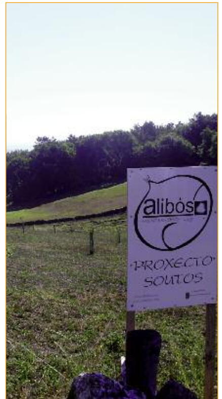
Nova plantación de castiñeiros dentro do Proxecto Soutos.

No sector somos os principais interesados e debemos servir de exemplo, é por isto que en Alibos iniciamos un convenio, a través da Deputación de Lugo, con diferentes propietarios da provincia para rehabilitar soutos e executar a plantación de 250 Ha que pretenden ser o escaparate do que deben ser as novas plantacións feitas en Galiza, apostando por unha ou dúas variedades de calidade, planificadas para a recollida mecanizada e utilizando os tratamentos culturais axeitados.