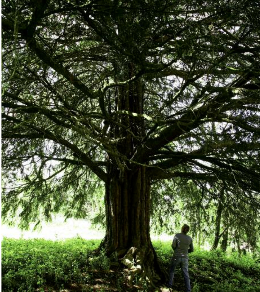
Teixo de Balmonte (Castro de Rei, Lugo).