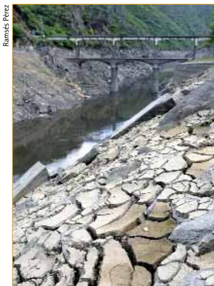
Canon do Sil, medio seco polas obras do encoro de Santo Estevo.

Ao tempo, chegaban os chamados Plans de Desenvolvemento Agrario que impulsaban as concentracións parcelarias, os regadíos e os plans de colonización de terreos “baldíos”. O desecamento da Lagoa de Antela na Limia, na provincia de Ourense (1960-1965), e as obras de colonización da Terra Chá (1956-1980), co desecamento das Lagoas de Cospeito, na provincia de Lugo, son exemplos destas nefastas actuacións sobre o territorio e o ambiente.