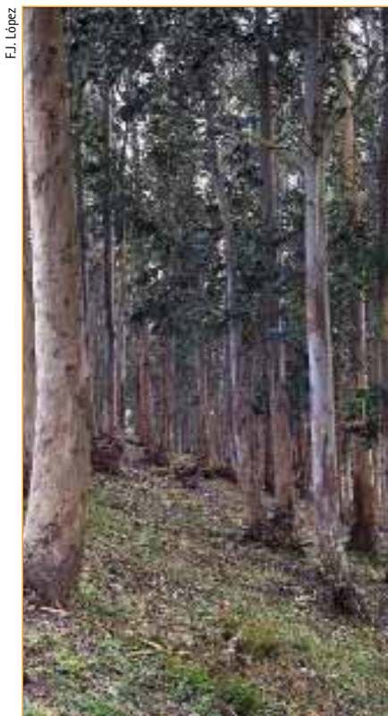
Desde os anos 50 o eucalipto estendeuse por toda Galiza co apoio das distintas Administracións públicas.

As infraestruturas do transporte tamén comezan a proliferar nestes anos de despegue económico do Estado, mais