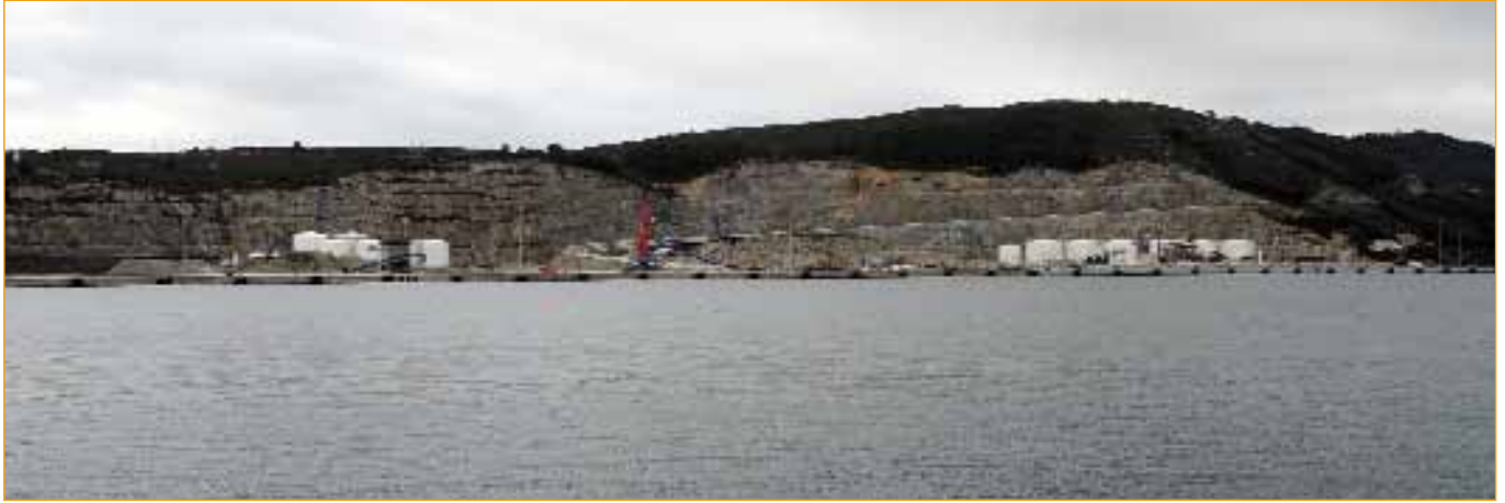
Desmorte por mor do porto exterior de Ferrol, hoxe apenas utilizado.

anunciar proxectos que veñen a demostrar que tal debate responde tan só a un trámite de obrigado cumprimento. Recupérase a vontade de poñer a andar proxectos desbotados como o da piscifactoría de Touriñán, a ponte sobre a ría de Noia, ou a mina de andalucita nas Pontes, sen agardar polo Plano de Protección do Litoral ou polos Plans de Ordenación da Rede Natura; modifícase o Plano Acuícola, pero non para protexer os espazos afectados, senón para permitirlles aos promotores acceder á propiedade do solo; anúnciase a recuperación dos proxectos hidroeléctricos paralizados polo bipartito, obviando as irregularidades observadas na avaliación ambiental ou no outorgamento das concesións ou sen sequera agardar a tramitación do novo Plano Hidrolóxico; múdase a Lei do Solo para dar maiores facilidades á especulación urbanística, rebaixar proteccións e entregar novas categorías de solo á actividade mineira, ao tempo que se pretende a retirada de contenciosos administrativos contra a urbanización ilegal ou se promove un Plan Sectorial para a legalización de toda arbitrariedade urbanística do Concello de Barreiros; elaborase unha Lei Eólica para xustificar a anulación do concurso de megavattios anterior e devolver a explotación do vento ás