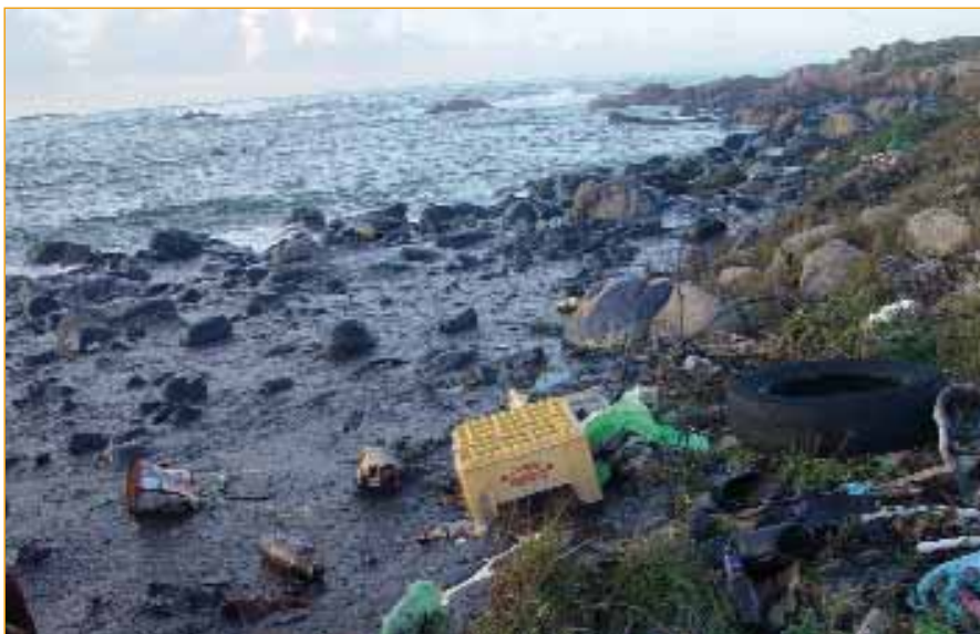
A pesar da catástrofe ambiental do Prestige, Galiza aínda non dispón de porto refuxio.

“Cámbiase o Plano Acuícola en favor dos promotores, anúnciase a recuperación dos proxectos hidroeléctricos paralizados polo bipartito; múdase a Lei do Solo para facilitar a especulación; elaborase unha Lei Eólica para devolver a explotación do vento ás grandes empresas do sector; e apóstase novamente polas autoestradas e pola incineración...”