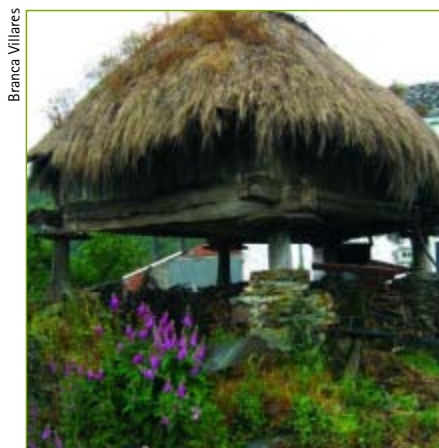
Horro de Pobra de Burón