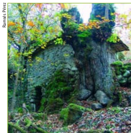
Muiño e castiñeiro