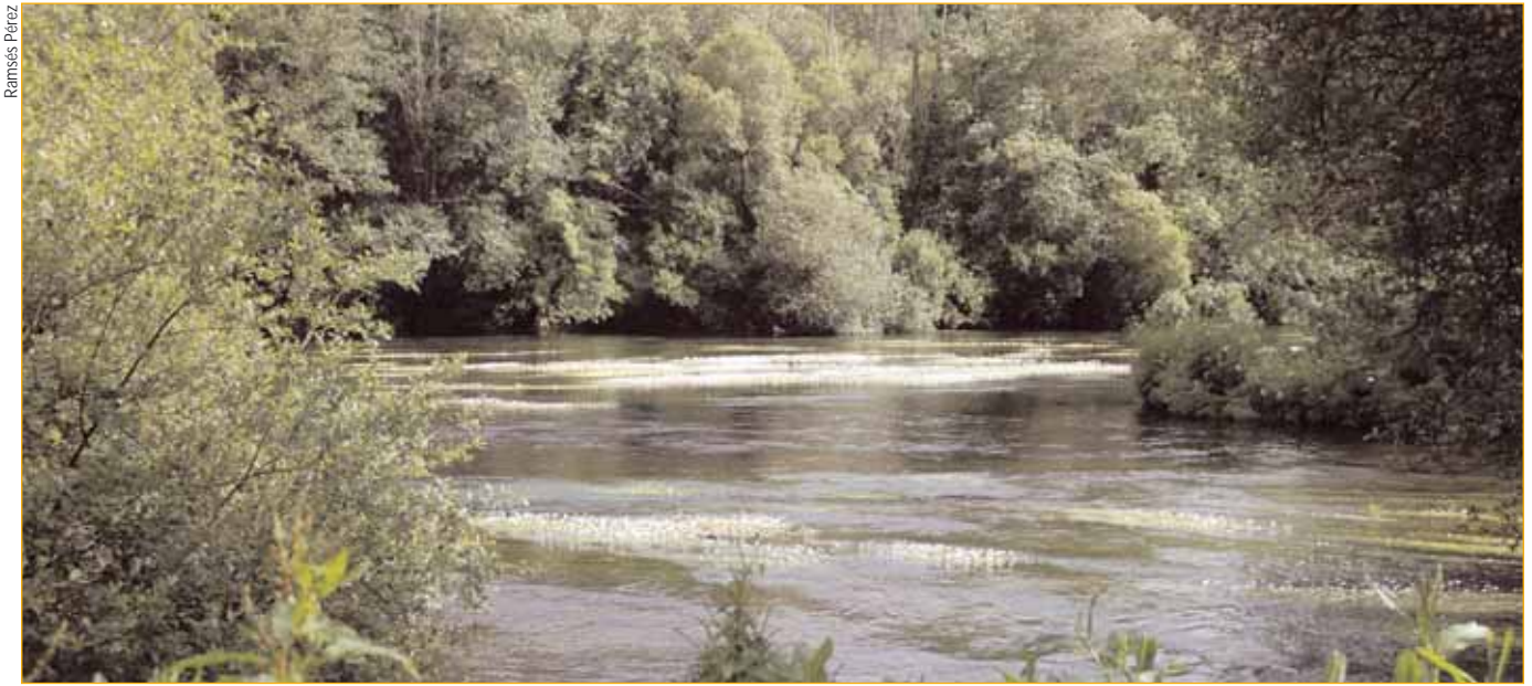
Ribeira do río Tambre.

A Federación Galega de Pescadores e a organización ecoloxista Adegga, promotora da Iniciativa Lexislativa Popular para a protección dos ríos e inmersa nos problemas que afectan á Natureza, non saímos do noso asombro ao observar e comprobar o abandono por parte das Autoridades autonómicas respecto ao coidado, restauración e mantemento do incomparábel patrimonio medioambiental que supoñen os nosos ríos e ribeiras, xa que as partidas económicas destinadas para a restauración dos afluentes foron insuficientes.