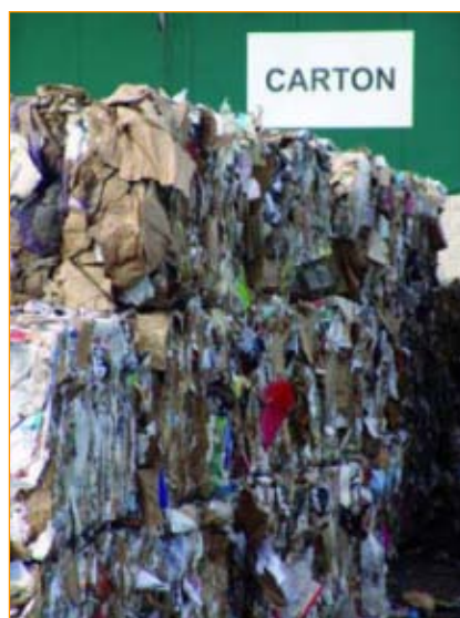
Os residuos que separamos clasifíncanse por fraccións e recicláncse creando novos obxectos