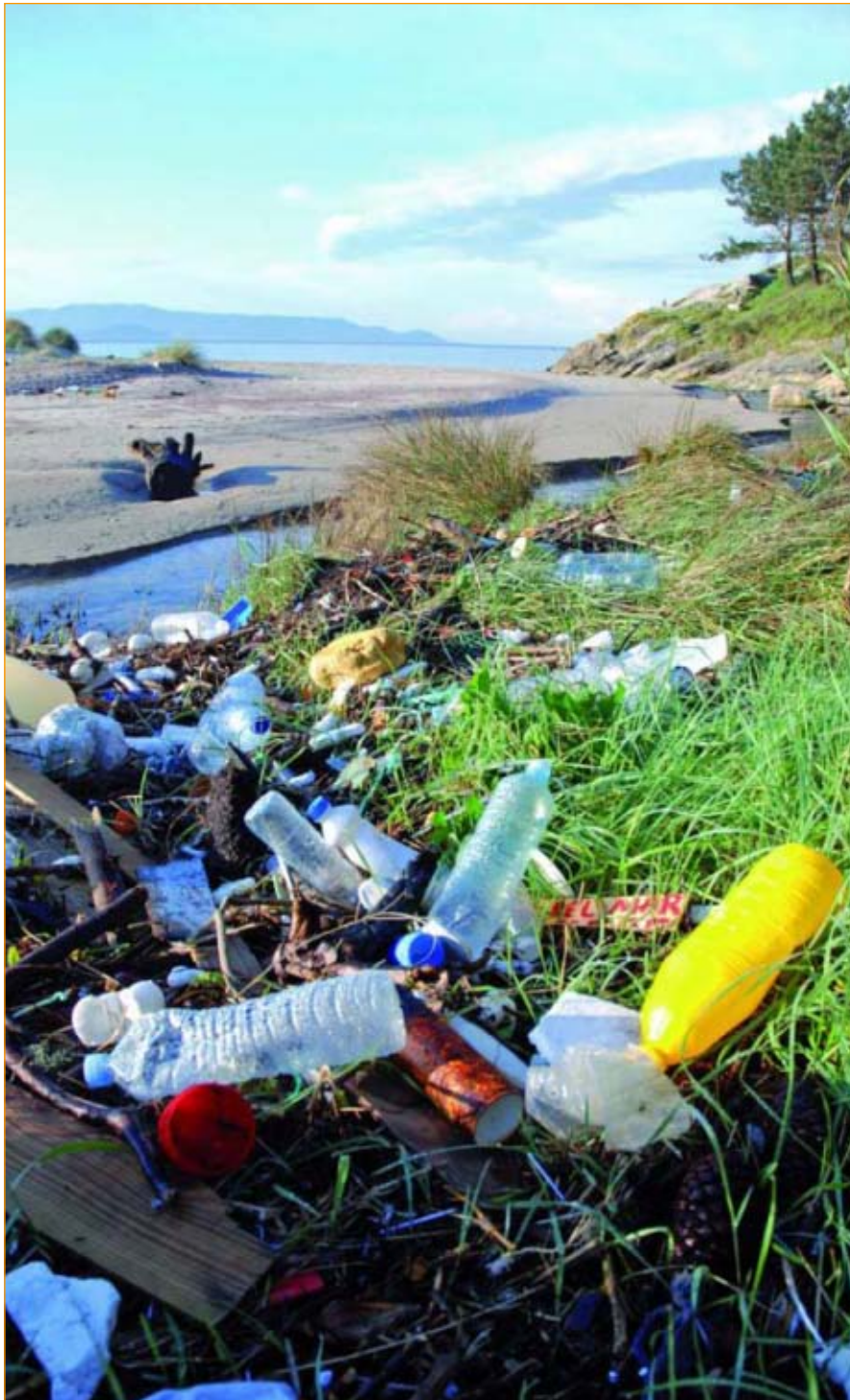
O lixo segue presente en moitos dos nosos espazos naturais

Pensar que o problema do lixo está solucionado por haber catro contentores nas rúas e outros tantos no fogar é unha ilusión que non nos podemos permitir. Cando sexamos quen de ir reducindo paulatinamente a nosa produción de residuos até o mínimo e darlle novas oportunidades a cada unha das fraccións, poderemos dicir que a cousa vai no bo camiño. Entón, esa capacidade permitiranos afirmar que vivimos nunha sociedade avanzada e moderna.