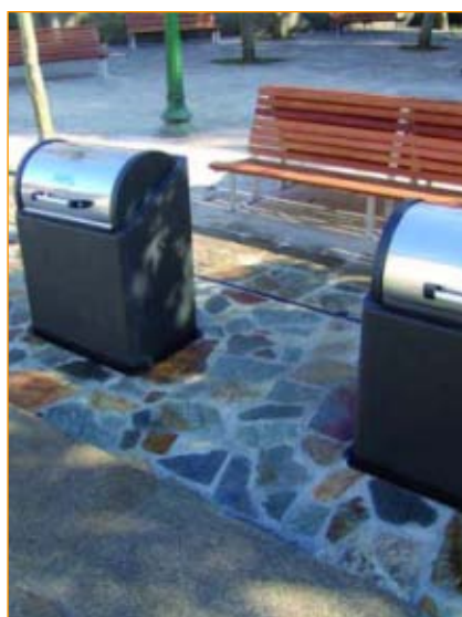
Aínda que a separación de fraccións é cada vez máis frecuente a produción do lixo non para de aumentar

Dende o movemento ecoloxista e as diferentes directivas da UE vense defendendo que a mellor solución aos residuos é non producilos. Polo tanto, o