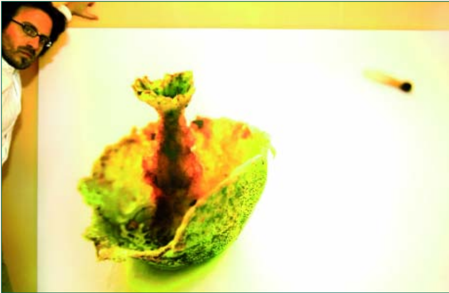
Caiuco, fame e inmigración / Xacobe Meléndrez

lixo, e teño en fase de produción o da auga coa exposición "Memoria auga" e unha videoinstalación en espazos públicos "Enriba da pegada humana-Over human track" na que xogo con este elemento e co concepto de ruína. Estes están á espera de patrocinio, xa que me gustaría telos listos coincidindo coa ExpoZaragoza 2008.