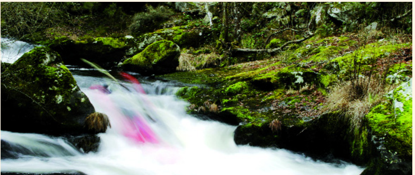
Memoria Auga / Xacobe Meléndrez