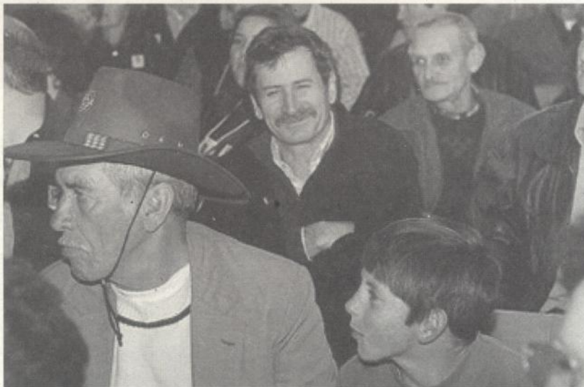
Unha imaxe que di moito: o gobernador do Rio Grande do Sul, Olívio Dutra, asiste, entre os participantes, a unha das asembleas do Orçamento Participativo. En 2000, 281.000 persoas participaron en 670 asembleas.

O proceso do OP consta de varias fases, comezando coa celebración de asembleas nas 22 rexións do Estado e nos seus case 500 municipios e rematando coa constitución do Conselho do Orçamento Participativo (COP).